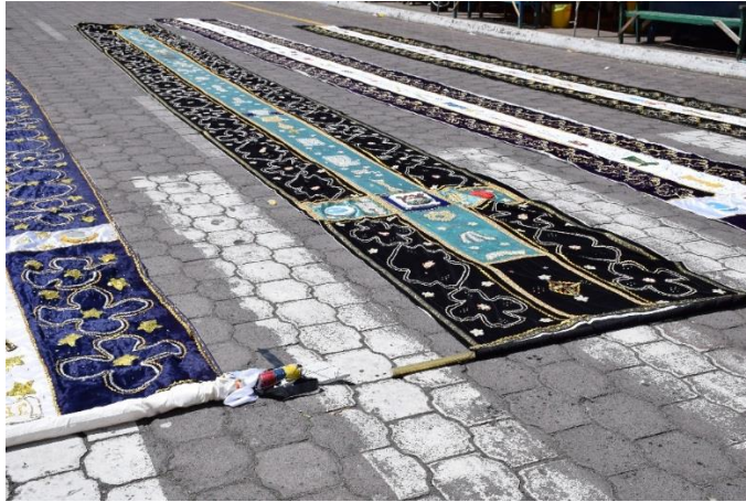
Imagen 9. Caudas