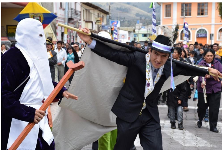
Imagen 2. Procesión del Arrastre de Caudas de Saquisilí

Dentro del campo del patrimonio inmaterial, hay factores como la periodicidad de los rituales, de las festividades y de los espectáculos en fechas únicas cada año, lo que ha dificultado su adecuado registro de los mismos, debido a la falta de investigación sobre ellos. El Arrastre de Caudas de Saquisilí , manifestación cultural categorizada como “usos sociales, rituales y festivos”, no pudo ser registrada debido a que su celebración se realiza en un solo día del año, el “Viernes Santo”, y se presume, por tanto, la ausencia de investigación.