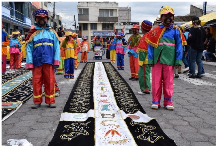
Imagen 7. Negritos y cauda

Niños mestizos pintados sus rostros de negro. Recuerdo remanente de la esclavitud durante la colonia. Los pequeños, vestidos con coloridos trajes, se ubican a los lados de la cauda procurando evitar su atoramiento con algún obstáculo durante su arrastre por las calles. También ayudan a girar la bandera en las esquinas donde el prioste no logra hacerlo por sí solo. Con el paso del tiempo, se ha perdido el personaje del negro mandamás , quien guiaba a los pequeños en la ardua tarea: “a los costados (...) 50 negros dirigidos por un robusto negro mandamás” (López Tapia, 1992, pág. 222).