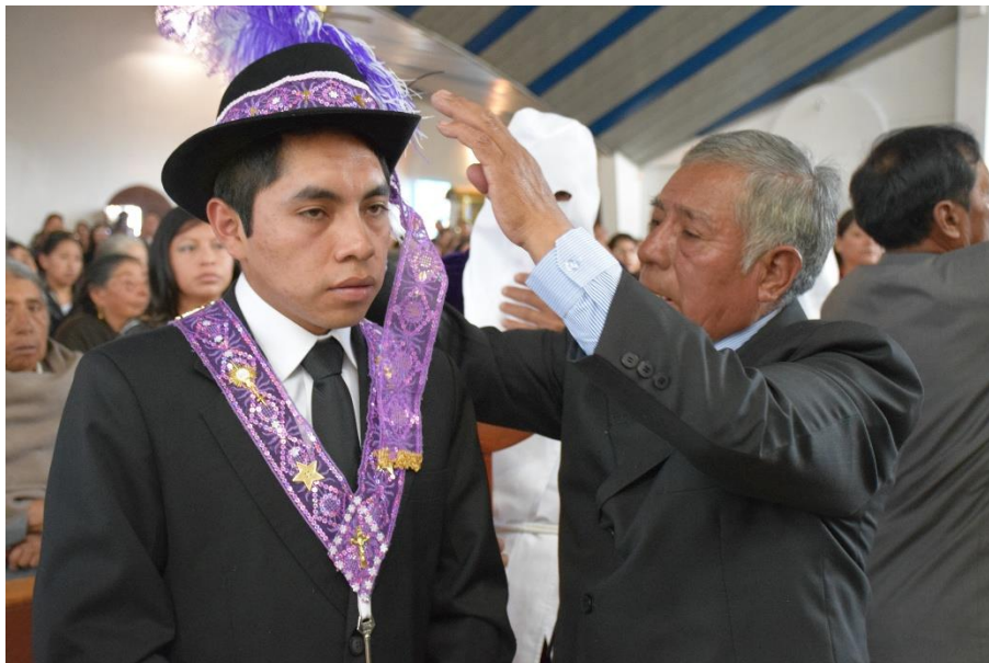
Imagen 3. Prioste junto a su padre

sombrero virado en su falda lateral, tiene una cinta blanca con flecos bordada, cruzada por el pecho, con una placa bordada con hilos color oro muy finísimo” (López Tapia, 1992, pág. 222). Él y su familia son los protagonistas de la celebración, por ende, corren con todos los gastos de la alimentación, la música y los disfraces de los acompañantes. Su renovación es anual y casi nunca se repite la misma persona.