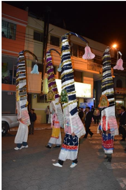
Imagen 4. Almasantas

La significación del almasanta es incierta. A pesar de varias indagaciones con ancianos y párrocos no se logró descifrar qué exactamente representa. En una lectura contextual y comparativa, se infiere que tiene una estrecha relación con la figura del danzante interandino, debido a su atuendo, a los elementos ornamentales y a la forma similar en que ejecuta su baile durante la procesión. Sin embargo, queda abierta la interpretación del inmenso cono que lleva en su cabeza. Sin duda alguna, el almasanta proviene de un profundo sincretismo cultural y religioso entre lo andino e hispánico. Podría representar la resistencia ideológica de los pueblos ancestrales al cristianismo. El danzante y posiblemente el almasanta encarnan a los yachak , protectores de la pachamama , guadores de los rituales, encubiertos en nuevos personajes durante la llegada española y el cristianismo. En la actualidad, siguen vigentes en las comparsas y procesiones, conservando la memoria y la identidad del pueblo mestizo.