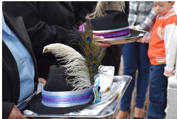
Imagen 10. Sombrero y llave

Sobresale por su colgante brillante que resalta a la vista en el pecho del joven. Tiene la forma de una llave antigua. Junto con el sombrero, son los dos instrumentos del prioste y cumplen la función de brindar identidad al personaje.