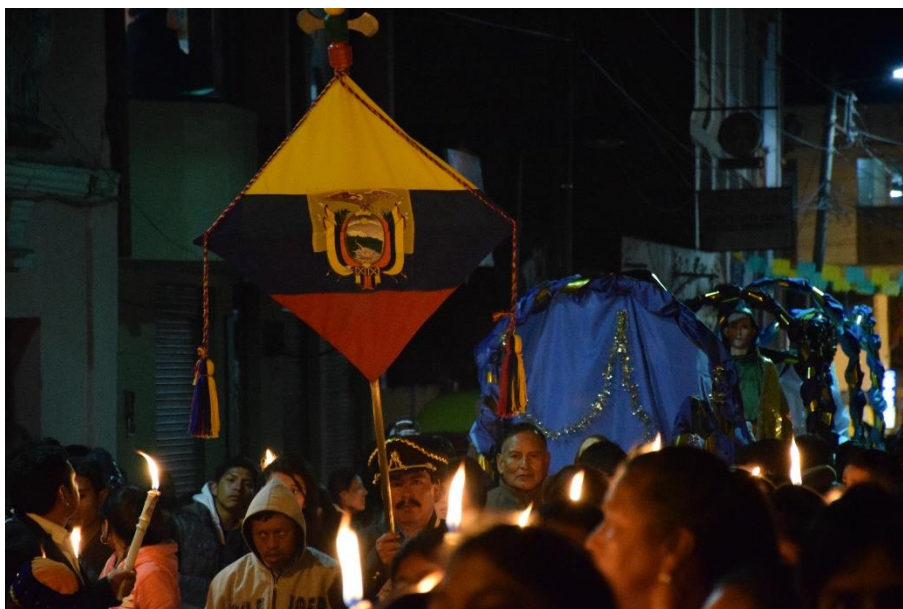
Imagen 8. Procesión nocturna del Arrastre de Caudas de Saquisilí

En la noche hay algunos cambios en la procesión. Quien lleva la cauda o bandera es un familiar del prioste , sea hombre o mujer. Las bandas van intercalando su música debido a su proximidad y ahora tocan la tradicional melodía: "salve, salve gran señora". La familia del prioste lleva en charolas la corona de espinas y los clavos, mientras que los jóvenes guardianes del sepulcro cargan el ataúd de Jesucristo descendido, junto con los "santos varones". Los cucuruchos van a los lados de la urna manteniendo el orden con sus bastones de madera. Al cierre de la procesión, se despliega una sucesión de los santos, como protagonistas en la escena de muerte de Jesús (La virgen María, María Magdalena y Juan Bautista) en coloridas andas adornadas con papel brillante, que resplandece con la luz de las velas.