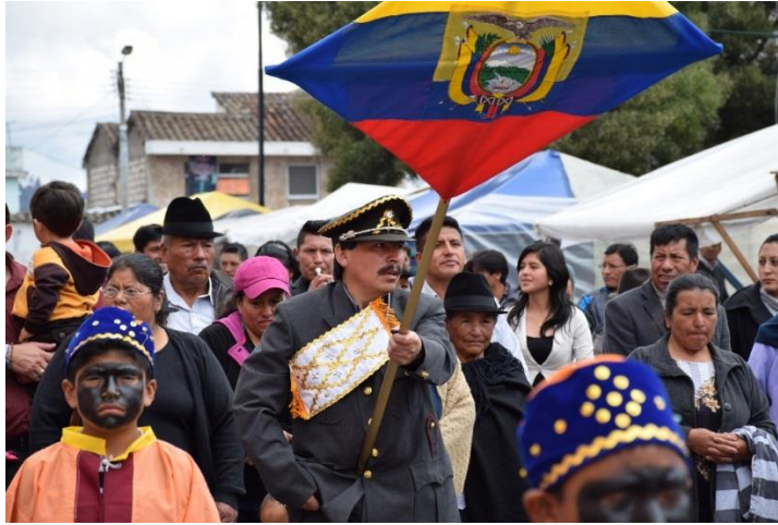
Imagen 6. Capitán pisabandera