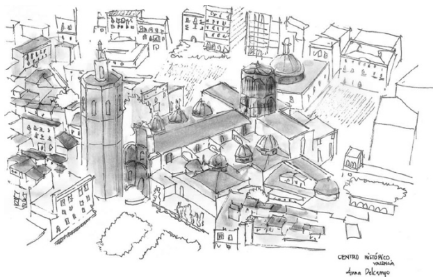
Figura 2. Centro Histórico de Valencia. Convivencia con la ciudad nueva

Ante todo el análisis expuesto, y con un claro conocimiento de la realidad actual, conociendo el problema al que se enfrentan los centros históricos, se propone una recuperación de su valor, a partir de un extenso análisis de cada centro histórico, mediante criterios arquitectónicos, urbanísticos, tipológicos, etc., para que puedan potenciarse y el propio centro vincularse a la globalización (Figura 2). “Deberemos generar políticas que, buscarán un centro histórico venido de la diferencia y que transmita hacia la diferencia; que se asienta en el pasado histórico y que construya un futuro que exprese el derecho a la ciudad y que sea generador de más ciudadanos para más ciudad, en el marco del desarrollo de identidades, el encuentro y la participación” (Carrión, 2000, p.6)