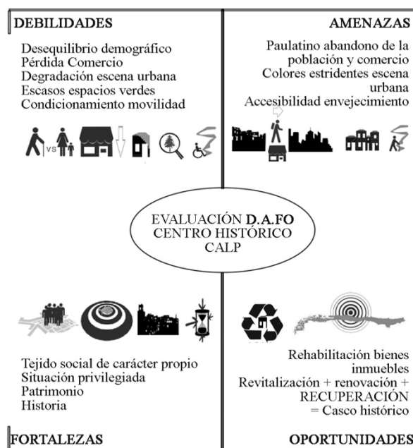
Figura 4. Resumen del D.A.F.O realizado tras la diagnosis del Centro Histórico de Calp

Basándonos en numerosos estudios y análisis técnica D.A.F.O (Figura 4), generados en diversas ciudades de España, y conocidos por su éxito, como son el caso de Zaragoza (2005) o el de Madrid (2007), se redactan las conclusiones extraídas del análisis previo realizado.