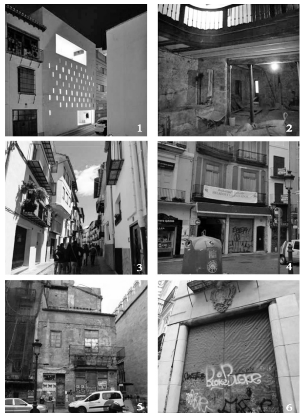
Figura 1. Casos de estudio

- Adaptación de los edificios más antiguos y de los espacios urbanos, en ocasiones una adaptación inadecuada, primando los elementos impropios a una intervención respetuosa que aporte valores que potencien y dialoguen armoniosamente con su entorno, sin destruir o poner en peligro aquellas características que lo hacen meritorio de ser conservado.