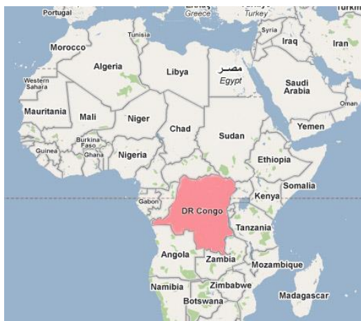
Figura 1 Ubicación de la RDC en África

El Índice de desarrollo humano (IDH) de la RDC según informe del Programa de las Naciones Unidas para el Desarrollo (PNUD - 2016), la situó en el puesto 176 de la tabla de 188 países. Esta situación tiene que ver con su posición geoestratégica y su legado histórico de violencia y corrupción.