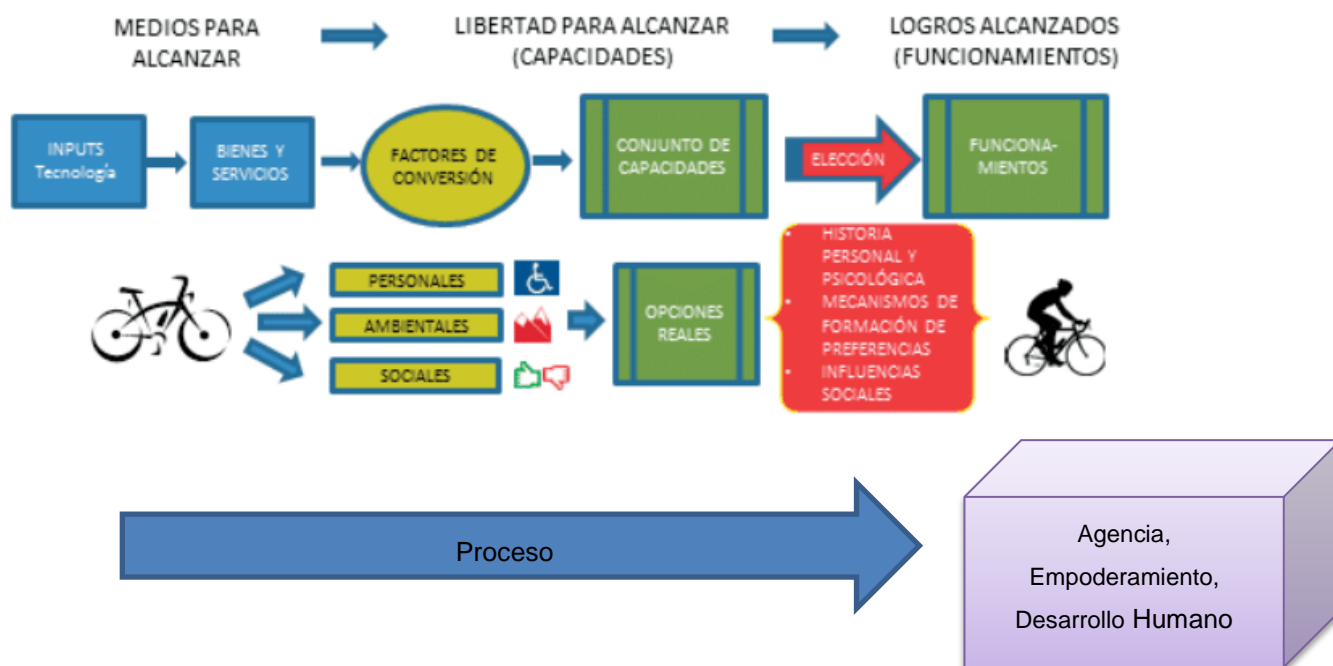
Figura 3 Representación no dinámica del conjunto de capacidades de una persona. (Complementada)

El EC considera todos los aspectos que componen el proceso para llegar al desarrollo, entendiendo para ello a las personas individual y colectivamente, dentro de sus contextos.