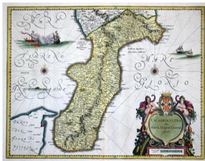
Fig. 1- Calabria Ultra olim Altera Magnae Graeciae pars

che molti di questi erano ubicati in un sito diverso da quello che si presumeva e che alcuni erano di fattezze affatto diverse da quelle che si immaginavano. Dunque anche dal punto di vista storico riteniamo che il Codice rappresenti una scoperta di straordinaria importanza, ed è per questo motivo che nel 2014 la Regione Calabria ha deliberato di candidarlo al Programma UNESCO "Memoria del Mondo" per la salvaguardia del patrimonio documentale.