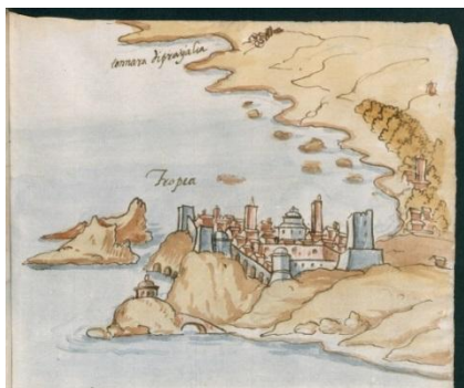
Fig. 2- Tropea

Da notare che nel medesimo disegno vi sono due croci per le quali la didascalia dice: “Dove son signate le croce bisognano le torre che una è nella carta precedente et l'altra nella seguente”.