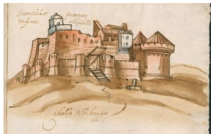
Fig. 3- Castello di Reggio Calabria

Montecassino. Nella parte alta la scritta indica la “tonnara di prayalia”.