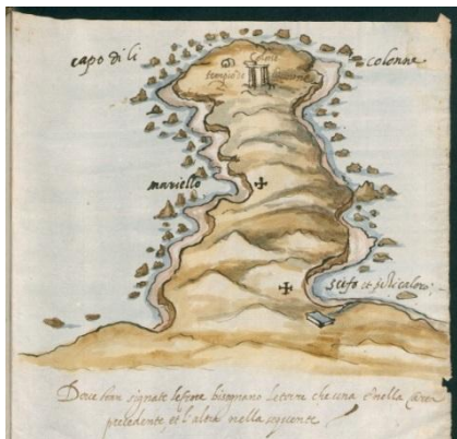
Fig. 1- Capo Colonna

Alcune immagini tratte dal Codice possono meglio far capire la qualità del documento di cui stiamo parlando.