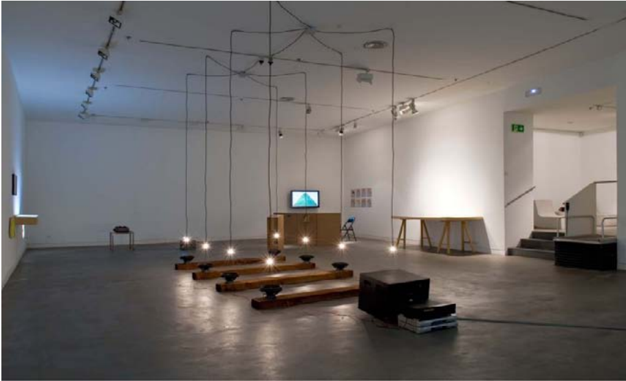
Fig. 2. Pulsar , 2013. Fundació Tàpies Barcelona.