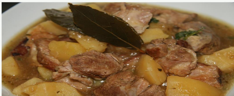
Imagen 2: Receta caldereta

Se vierte el aceite en la sartén y todos los ingredientes. Se le añade el agua y vino blanco en una proporción de un vaso de vino por dos de agua, dejando cocer una hora y media hasta que quede en su jugo.