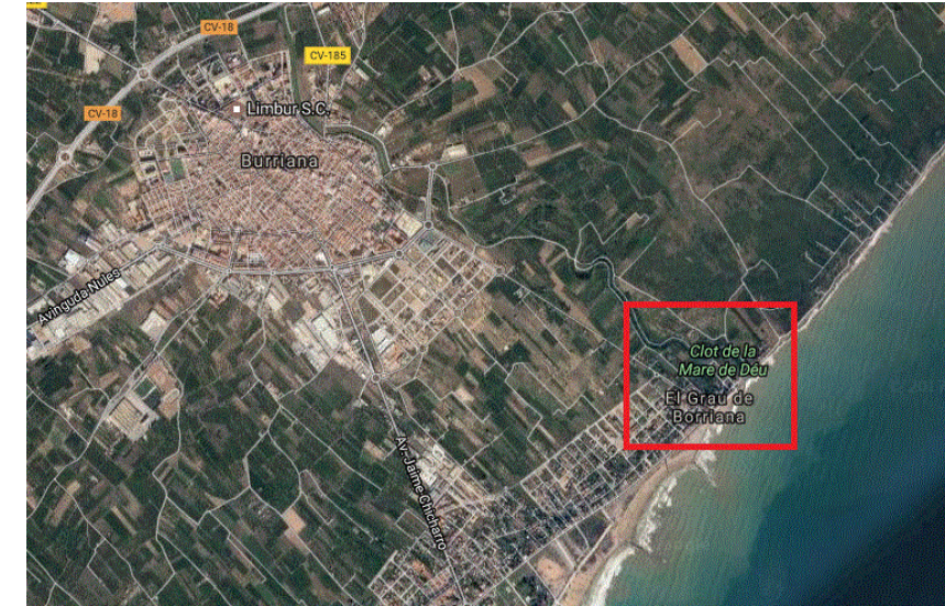
Imagen 1. Municipio de Burriana

La pasarela se encuentra en el paraje natural del “Clot de la Mare de Déu” en el municipio de Burriana (Castellón).