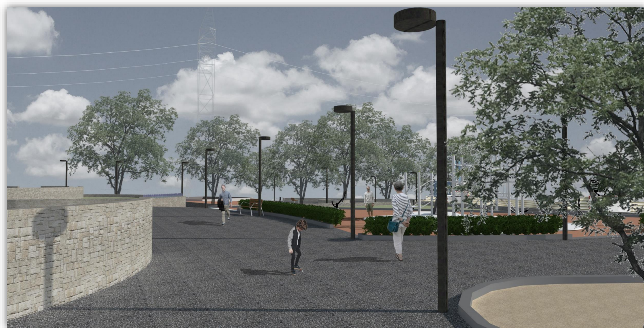
Modelado 3D de plaza para esparcimiento