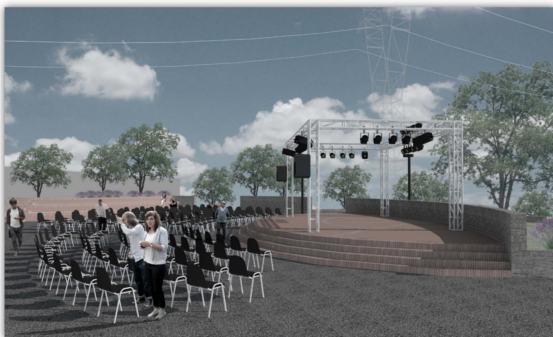
Modelado 3D de escenario con sillas portátiles

Este proyecto lo realizo como funcionario y arquitecto técnico municipal del departamento de urbanismo en el mismo Ayuntamiento de Picassent, siendo su objetivo final la licitación, adjudicación y ejecución del mismo. Por lo tanto, la participación ciudadana, consultas populares y cubrir la demanda social es una de las prioridades.