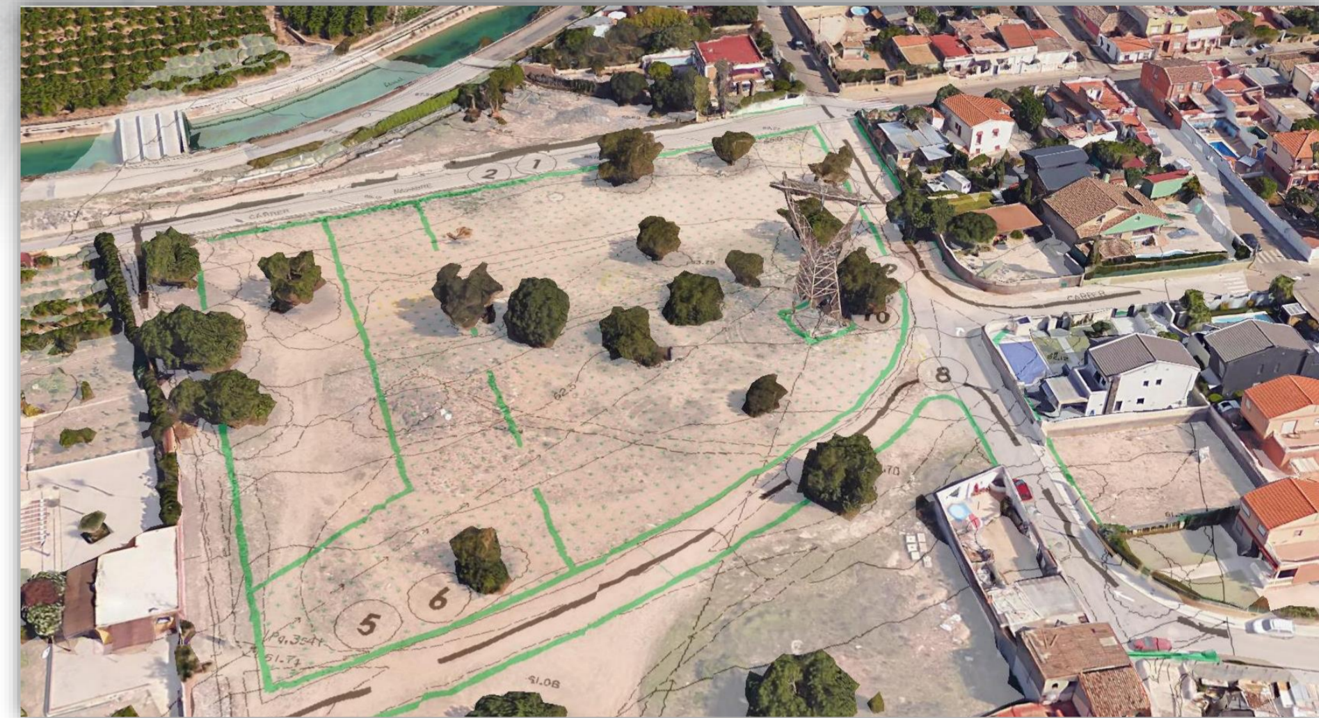
Plano de ordenación pormenorizada del PGOU de Picassent incrustado en imagen 3D