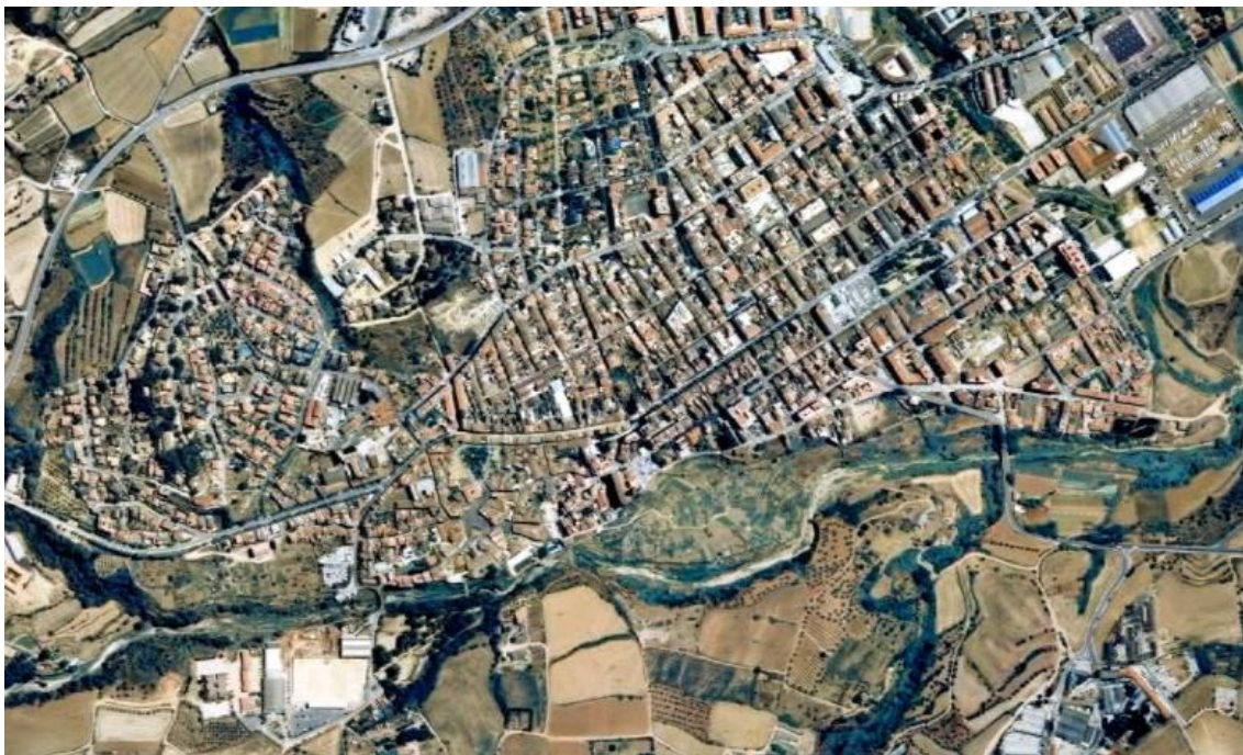
Fig. 2. Modelo de ciudad no orgánica, desvinculada de su entorno. Foto aérea de la localidad a inicios del s. XXI.