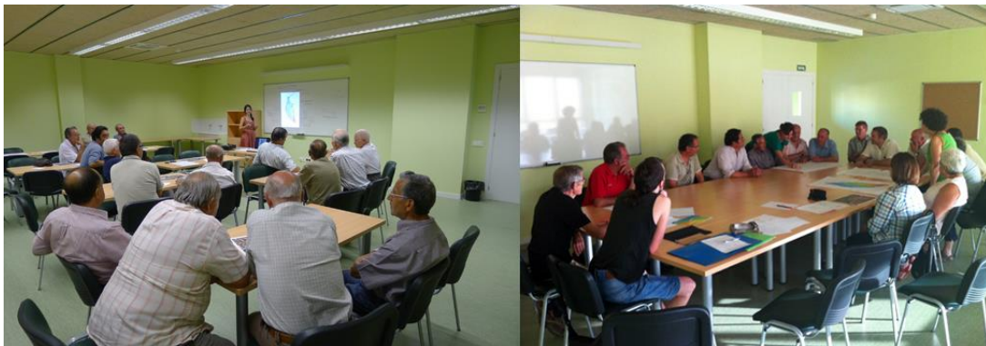
Fig. 3. Montaje del proceso de trabajo de IAP con la comunidad de regantes durante el proyecto.

Analizar el lugar desde su pasado, presente y futuro facilita a todos los agentes participantes (nosotras inclusive) la posibilidad de identificar y revalorizar el patrimonio del lugar, comprender otros casos similares, reconocer los saberes en prácticas ecológicas y activar el potencial de decisión para nuevas estrategias de autogestión en el futuro. Además, la posibilidad para un nuevo marco cognitivo sobre el lugar, un cambio de mirada y una transformación de la forma de percibir los valores del lugar.