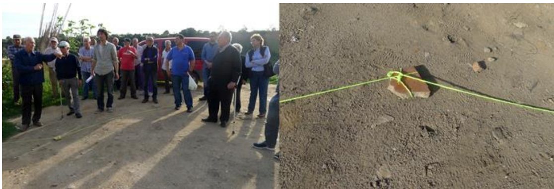
Fig. 5. Montaje del proceso de trabajo de IAP con la comunidad de regantes durante el proyecto.

Concluyendo, podemos decir que este proyecto pone en evidencia como uno de los retos que plantea el paradigma de la sostenibilidad es el de recuperar el patrimonio intangible de la gestión de los recursos, más allá del patrimonio físico, como herramienta para la transformación sostenibilista de las ciudades y su relación con el territorio. La dificultad asumida frecuentemente en las disciplinas de la arquitectura y el urbanismo de integrar los procesos participativos, se convierte así en una oportunidad de dotar a los proyectos en zonas patrimoniales de criterios solventes y avalados por el tiempo aportado por la memoria compartida de la comunidad.