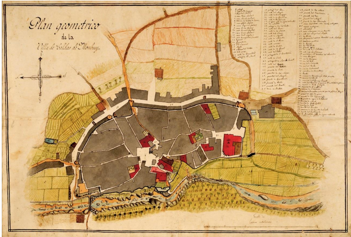
Fig. 1. Modelo de ciudad orgánica, abasteciéndose de su entorno. Plano de la localidad y huertas, fecha no precisa (siglo XVII).