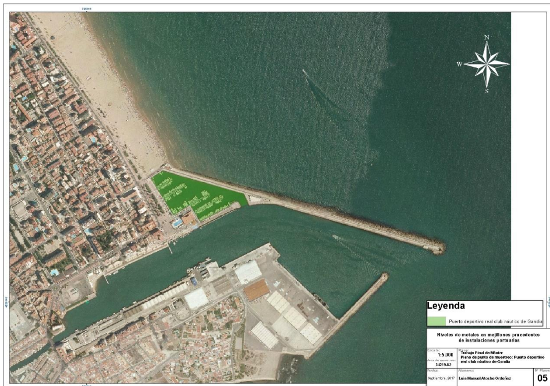
Anexo 7.1.5 Superficie de Puerto deportivo Real club Náutico de Gandia