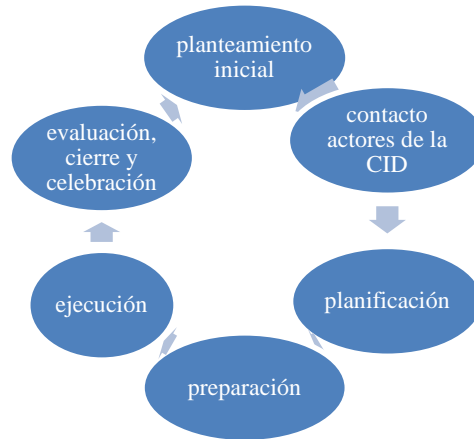
Fig.1 Fases del desarrollo de la propuesta de ApS en el MICID

Para una mayor comprensión, se describen a continuación las principales acciones y tareas llevadas a cabo en cada fase: