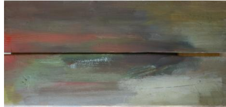
Fig 10, sin título , Jorge Luis Bea.

Así pues, la obra pictórica que pretende presentarse constará de seis paisajes abstraídos y deformados de escenarios narrados efrásticamente en el relato, sobre soportes de material reutilizado, cuatro de ellos de noche, los dos restantes de día.