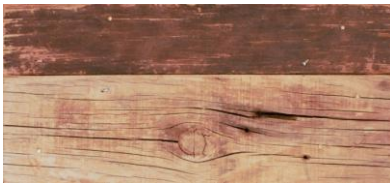
Fig 8, soporte sin imprimir.