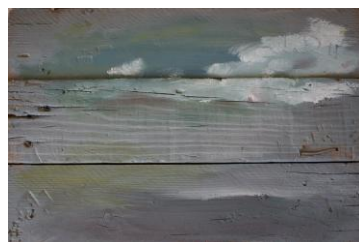
Fig 14, sin título , Jorge Luis Bea.