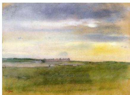
Fig 4, Bords de rivière , Degas.

En lo que respecta a la obra pintada, esta sigue la línea de significación de la escritura y pretende abordar los mismos temas. Los Haiku vuelven a ser en este medio un referente ineludible puesto que la idea de evocación y abstracción también en la pintura acentúan lo que los personajes sienten y transmiten esa ambigüedad que define al texto. Por ello además se ha apostado también por descartar la aparición de los personajes en las obras pintadas, como recurso para reforzar esta idea.