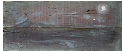
Fig 13, sin título , Jorge Luis Bea.