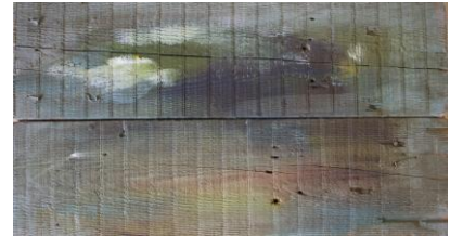
Fig 11, sin título , Jorge Luis Bea.