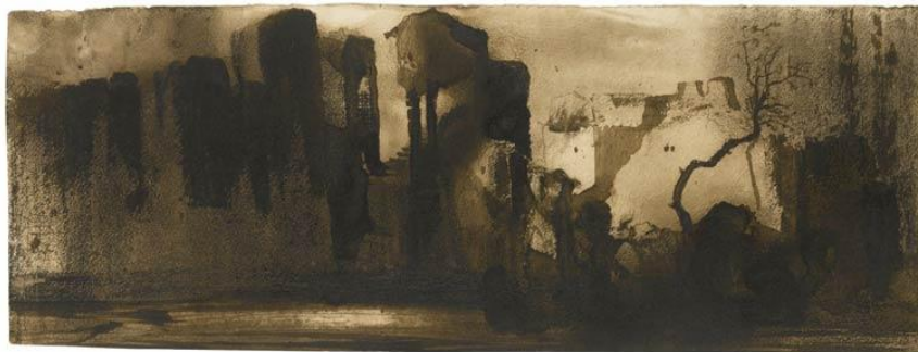
Fig 5, Sin título , Hugo.

También los dibujos a tinta de Victor Hugo, imágenes que sugieren recuerdos. Ruinas y paisajes lejanos, de otro tiempo. En su primera etapa dibujística, Hugo realiza sus dibujos en base a lo que ve en sus viajes, hambriendo de ideas, de imágenes, que enriquezcan su escritura. Con la pérdida de su hija Leopoldine en 1843, cesan sus viajes y también esta primera etapa de su dibujo, dando paso a un espacio de meditación que trasciende la realidad física hacia cuestiones más existenciales. Su dibujo se desliga del natural, transformándose y progresando bajo un impulso de necesidad de expresar esas imágenes mentales que son metáfora de temas primordiales para él en ese momento de su vida. Así, el dibujo va convirtiéndose en un campo personal de exploración, en un lenguaje íntimo que parece permitirle llegar donde no llega la palabra, con un tratamiento más austero y evocador, y descartando de éste todo lo que pudiera ser artificial o accesorio, para así alcanzar lo esencial de las cosas.