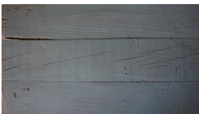
Fig 9, soporte imprimado.

y serenidad que aparecen con la edad, cuando la vida del objeto se evidencia en su desgaste o en algún remiendo 41 .