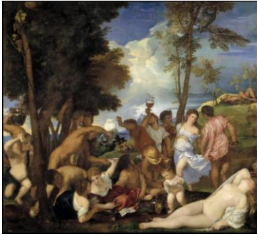
Fig 2, Centauresas , Antoine Caron.

hecho de que la imagen existe antes que la palabra, una relación que se opondría a la que ofrecen las distintas formas de la ilustración, donde el texto antecede a la imagen.