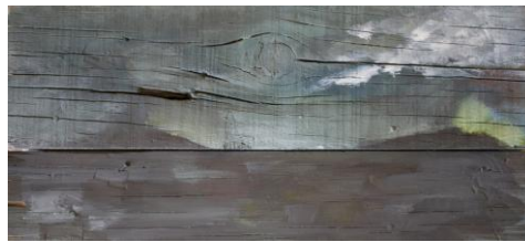
Fig 12, sin título , Jorge Luis Bea.