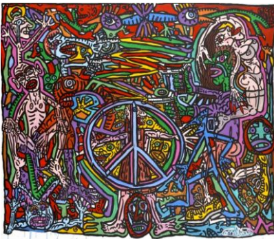
Fig 7, Sans Titre , Combas.