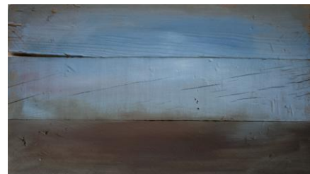
Fig 15, sin título , Jorge Luis Bea.