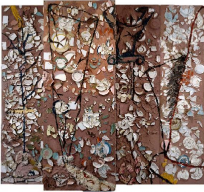
Fig 6, The Patients and the Doctors , Schnabel.