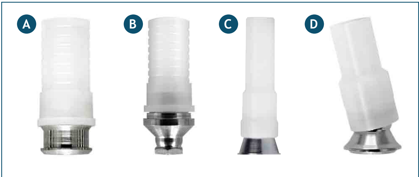
Figura 1. Pilares dentales ensayados: (a) UCS33, (b) PZIM35, (c) CO41 y (d) PDINT.