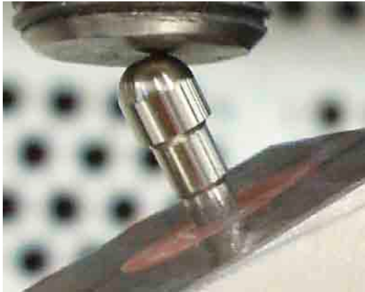
Figura 2a. Configuración del ensayo: pilares rectos.