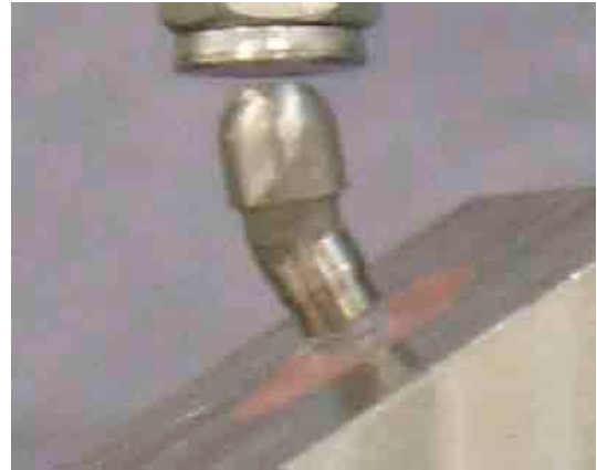
Figura 2b. Configuración del ensayo: pilares angulados.