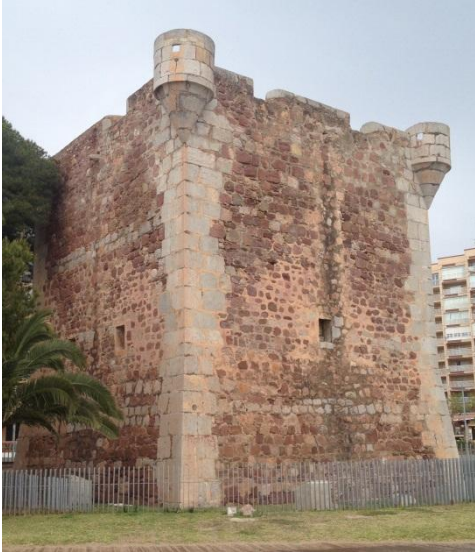
Fig. 1- Vista exterior de la torre de Sant Vicent.

Benicàssim y la misma villa. Se divisa la Torre Colomera de Oropesa y la sierra del Desierto de la Palmas.