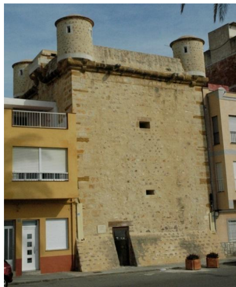
Fig. 4- Vista exterior de la torre de Torrenostra.

Al igual que la de Sant Vicent, su orientación es debida a la del mar que se encuentra al sur-este.