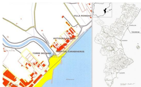
Fig. 1- Plano de situación y elementos citados.

la Universidad de Burriana atender a los guardas que residen en ella 3 ; la visita a las torres de 1607 que cita: “...en ella una pieza de artillería que tira cuatro libras... proveer... cerradura con su llave para el armario almacén donde está la pólvora...” 4 , o que la torre tendría dos soldados a pie y dos a caballo (Escolano, 1611). Estas atenciones hacia la defensa costera vendrían por la inseguridad creada por la piratería berberisca y los moriscos; ya que parte de los documentos se refieren a las torres como medio para el control del movimiento de estos últimos en la costa. Hay mas citas: en las ordenaciones de 1673 “Tiene un atajador, con obligación de hacer el atajo hacia la torre de Moncofa...” 5 o la certificación 1691 de la estancia de un soldado durante seis años en la torre (Serrano, 1997).