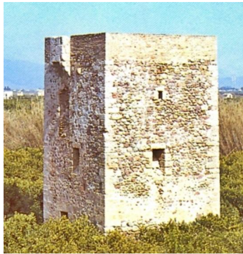
Fig. 4- Torre años 70 siglo XX (Mesado, 1991).

(9) La provincia de Castellón fue un importante teatro de operaciones y se proyectaron reformas de fortificación en Burriana en el año 1869 (Roca, 1932).