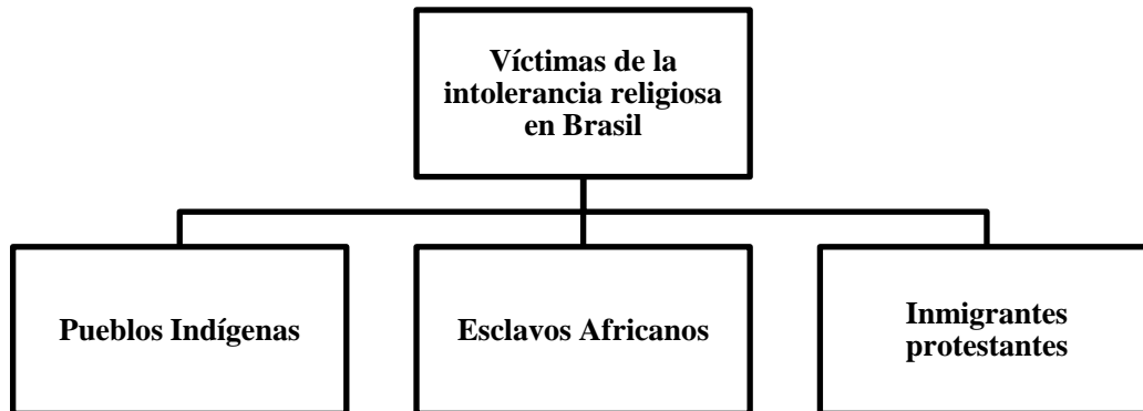
Figura 2. Víctimas de la intolerancia religiosa durante el período colonial en Brasil. Elaboración propia

En el contexto de la colonización, el interés de la Corona Portuguesa se centraba en la exigencia de mano de obra y guerreros para enfrentarse a los potenciales invasores (franceses y holandeses). La Iglesia Católica se alió con los designios del Rey de Portugal, construyendo la más poderosa alianza contra todos los que no profesaban la fe católica. En esa tarea, los jesuitas fueron el brazo ideológico de la Corona portuguesa en Brasil. Las principales víctimas fueron los tres grupos indicados en la figura 2.