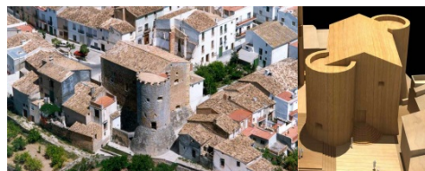
Fig. 2- Murla. Implantación urbana de la iglesia-fortaleza y modelo volumétrico (A. Banyuls y S. Pastor, 2009)

Para la fortificación de Calpe se proyectó doblar las murallas medievales, recreándolas con terraplenes y añadir dos nuevas torres artilladas en los vértices de levante y tramontana. En 1551 la edificación de la mayor de las dos torres —la situada a poniente y significativamente denominada como «la torre grossa» — estaba finalizada. Las obras de la situada en el vértice diagonalmente opuesto trataban de principiarse ese mismo año pero su efectividad exigía el derribo previo y conflictivo de algunas viviendas preexistentes tanto en el interior del recinto medieval como exteriormente en el arrabal: «per que la dita torre axí per part de dins com de fora stiga apartada de altres edefficis necessariament se haura de demolir alguna part de casa eo cases del dit loch de Calp» 2 Con las dos nuevas torres artilladas se perseguía finalmente un control visual y acción de tiro en todo el perímetro cuadrangular del recinto medieval. En 1551 también se había procedido a ya a engrosar con rellenos de tierra todo el lienzo sureste de la muralla medieval y se habían finalizado las obras de la torre y nuevo portal junto a la casa de la señoría.