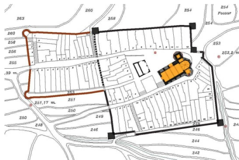
Fig. 3- Benissa. Estructura urbana y murallas ca. 1540 (A. Banyuls, 2009).

A pesar de ello, su emplazamiento, ocupando prácticamente una posición central en la estructura urbana de la villa, añadía una nueva problemática debido a la proximidad de las viviendas y la incompatibilidad que ello suponía con su función de fortaleza artillada. El mayor obstáculo, sin embargo, fue el que presentaba la situación de la casa abadía. Su ubicación aislada y su posición elevada frente a la escasa altura de la iglesia medieval la convertían en el principal reparo de la fortaleza: « com estant com esta la seglesia de Beniça baixa e la badia que hi esta al costat alta de aquella badia porien los enemichs ynvadir als que starien en la dita sglesia e aquella dita seglesia e fortalea no valdria res per ferse forts » 4 , por lo que, a pesar de la significación del edificio, se resolvió con su derribo.