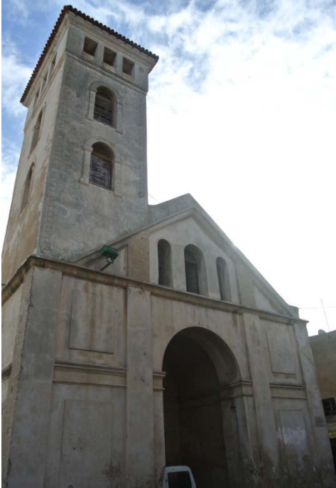
Fig. 5- Igreja Nossa Senhora de la Asuncion. Mazagan.