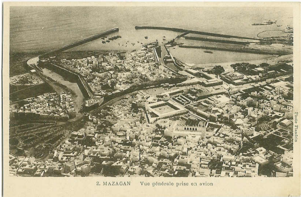
Fig. 9- Antigua fotografía aérea. Mazagan.