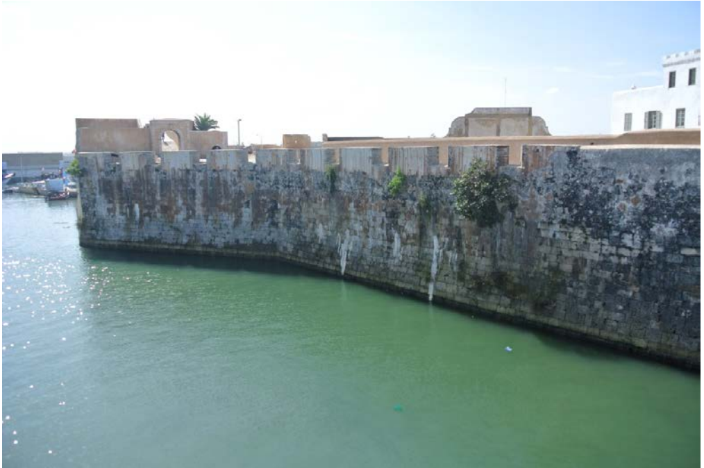
Fig. 4-Murallas. Mazagan.