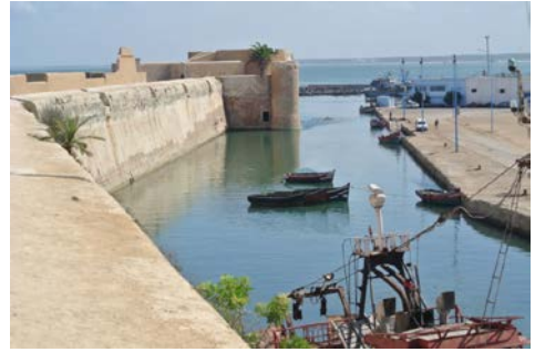
Fig. 8- Foso utilizado como dársena. Mazagan.

La ciudad portuguesa de El Jadida, representa una de las etapas sobre la ruta de Indias, ofreciendo un ejemplo eminente de un conjunto arquitectónico que marca el poderío portugués en tierras marroquíes en el momento de los grandes descubrimientos. Representa por este hecho uno de los ejemplos “la arquitectura más espectacular y la mejor preservada militar y ciudadina del renacimiento, así como de la expansión portuguesa en el mundo”.