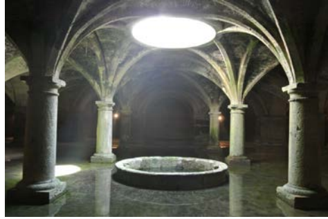
Fig. 7- Cisterna. Mazagan.