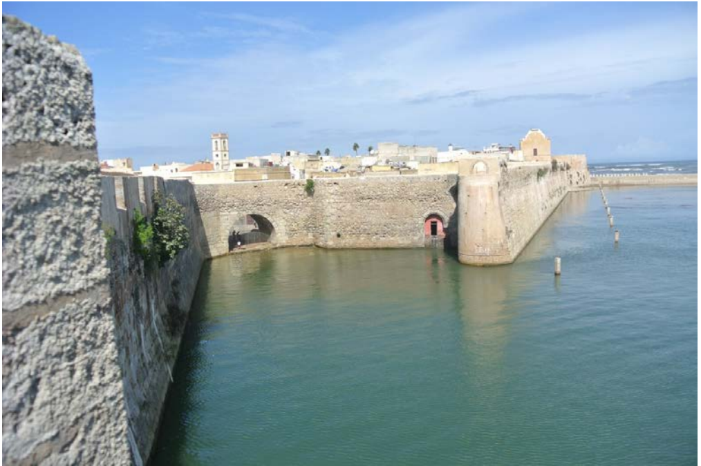
Fig. 3-Murallas. Mazagan.