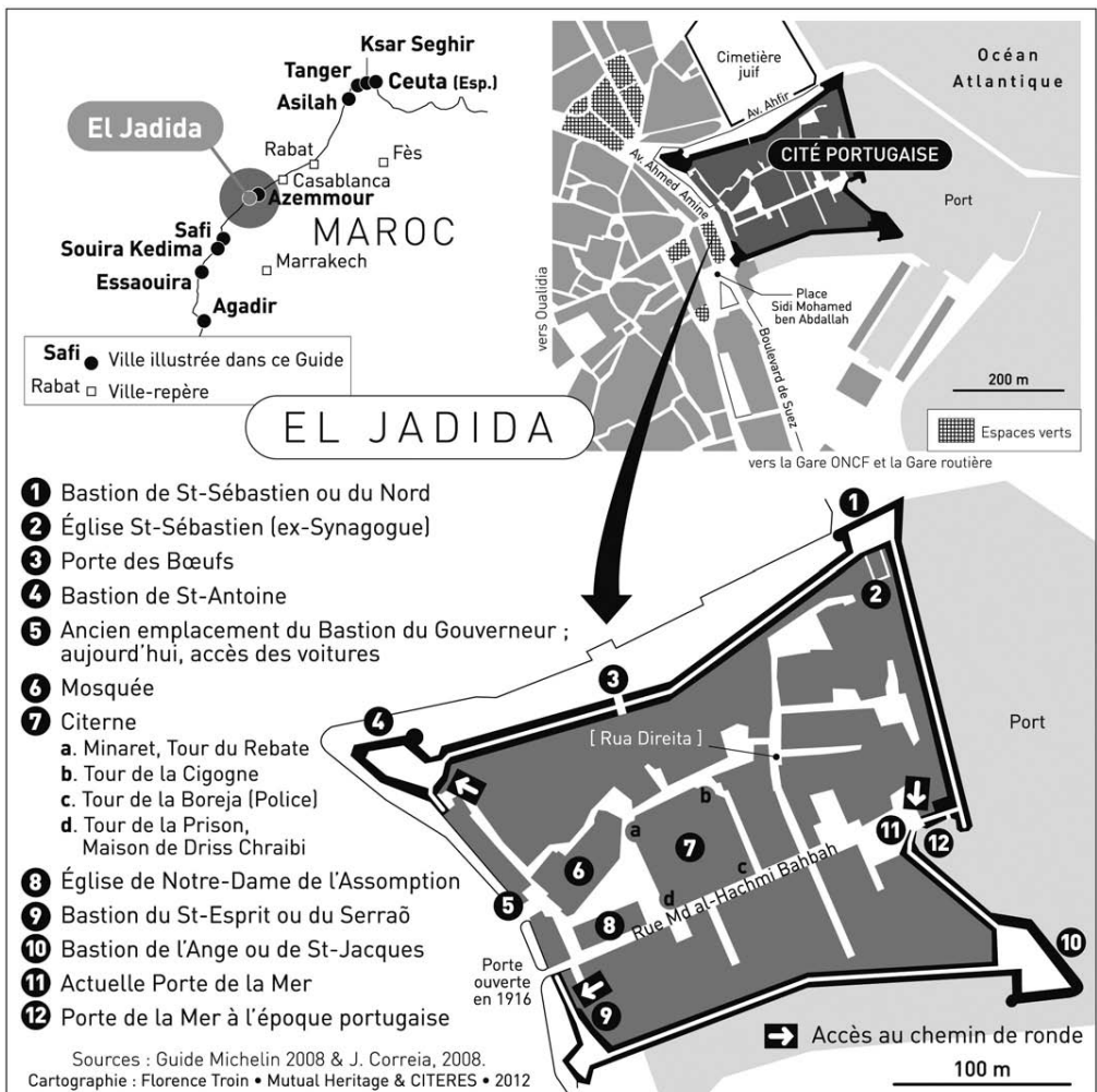
Fig. 2- Descripción de la ciudad.

Explosiones que hicieron un gran número de víctimas así como la destrucción del bastión del Gobernador y de una gran parte de la muralla. La ciudad quedó abandonada durante más de medio siglo, a la que se le otorgó el nombre de “la Destruída”. Hasta que a mediados del siglo XIX, el Sultán Moulay Abderrahman ordenó al pacha de la región realizar el levantamiento de las partes destruidas su restauración así como la nueva construcción de una mezquita. Prohibió la utilización del nombre Mazagan, renombrando la ciudad con el nombre de “Al-Jadida”, “la Nueva”.