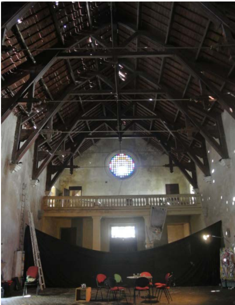
Fig. 6- Igreja Nossa Senhora de la Asuncion. Mazagan.