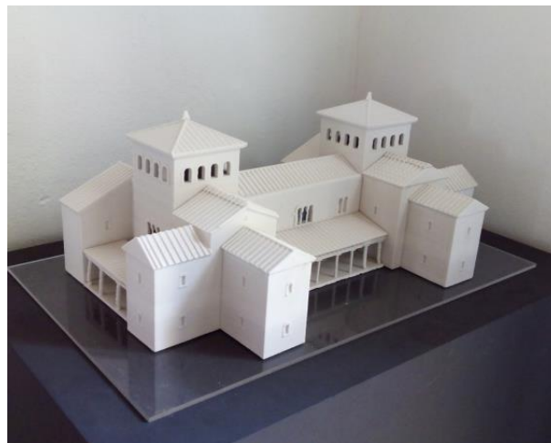
Figura 4: Maqueta en el Museo Visigodo de Pla de Nadal.

Esta reconstrucción se ha usado profusamente en el nuevo Museo Visigodo de Pla de Nadal (MUPLA), y en una serie de publicaciones divulgativas. También se usa en las visitas guiadas que desde hace años se realizan en el yacimiento. Asimismo se ha presentado en congresos internacionales sobre palacios y centros de poder en la época visigoda.