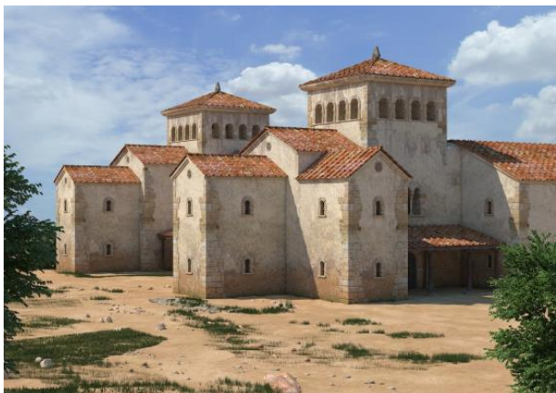
Figura 3: Vista desde el sudeste, de la reconstrucción infográfica del palacio.