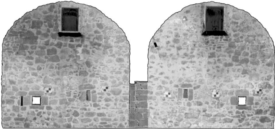
Fig. 5- Bóvedas de la planta principal. Sección transversal obtenida mediante nube de puntos (Elaboración gráfica: S. Lillo)

La planta de coronamiento está constituida por el camino de ronda y el pretil sin almenas. Se accede desde la planta alta a través de una pequeña escalera situada junto a uno de los garitones.