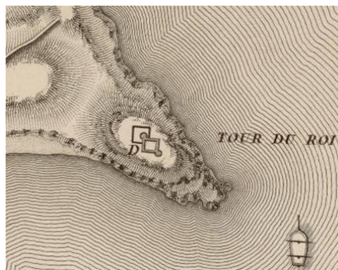
Fig. 3- Plan du fort d'Oropesa et de la Tour du Roi assiegés et pris en octobre 1811 (E. Collin, 1828)

en labrar el fuerte que tenemos dicho (la torre del Rey)” (Escolano, 1972), cantidad que Sebastián García reduce a quince mil al tiempo que destaca el hecho de que “raramente la iniciativa particular se ocupaba de edificar una fortaleza como hizo el Sr. de Oropesa D. Juan de Cervelló en 1534 con gasto de 15.000 ducados...” (García-Martínez, 1972).