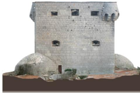
Fig. 6- Alzados Noreste y Noroeste obtenidos mediante fotogrametría (Rodríguez-Navarro).

mampostería trabada mediante argamasa de mortero de cal. En el aljibe se utiliza el mismo tipo de cubierta.