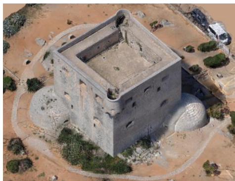
Fig. 7- Perspectiva isométrica obtenida mediante fotogrametría (Rodríguez-Navarro).

consecuencia del actual modelo de desarrollo turístico. Efectivamente, la torre del Rey se encuentra en la actualidad rodeada de edificios de apartamentos cuya altura en relación con ella conlleva la pérdida del carácter referencial y estratégico, de hito costero, que durante varios siglos ha supuesto una de las características principales de las torres de vigía y defensa del litoral. Se hace por tanto necesario una vez más advertir sobre las amenazas que ponen en riesgo no únicamente la idiosincrasia de nuestro patrimonio construido, sino también su propia existencia, incidiendo en la importancia de protegerlo y conservarlo a través de su estudio, su conocimiento y su puesta en valor.