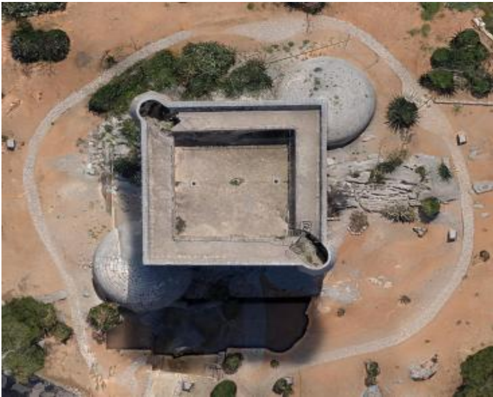
Fig. 4- Planta aérea obtenida mediante fotogrametría (Rodríguez-Navarro).

La planta baja queda dividida en dos espacios iguales por un muro intermedio. Los espacios resultantes se cubren por medio de bóvedas de cañón. De la planta principal queda tan sólo el posible vestigio de una almena entre los sillares de la nueva torre que hace suponer un remate almenado situado al nivel del primer piso de la torre actual.