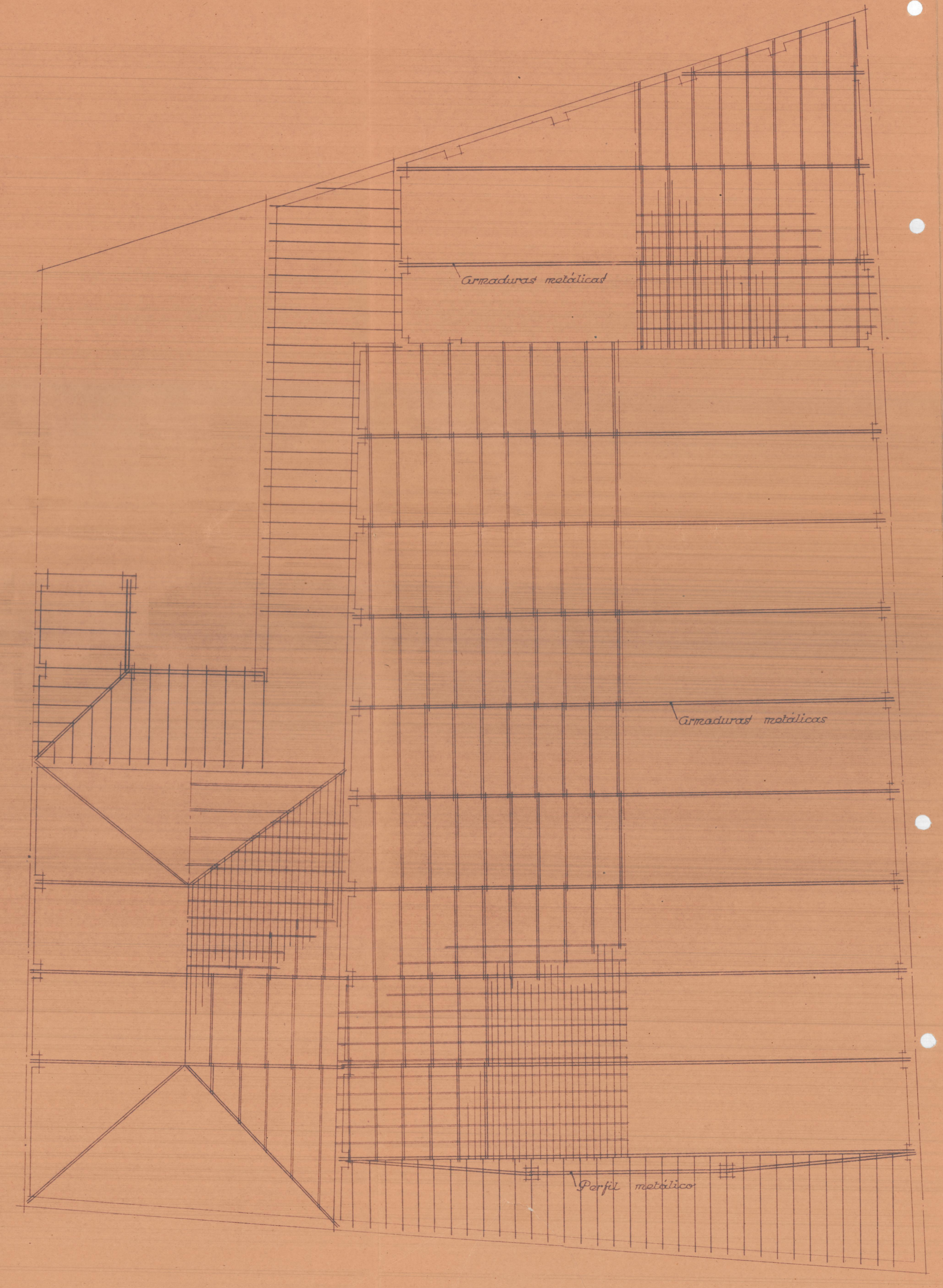
PLANTA DE ESTRUCTURA DE CUBIERTAS

PROYECTO DE TEATRO CINE Y LOCAL SOCIAL PARA EL ATENEO MUSICAL Y DE ENSEÑANZA BANDA PRIMITIVA DE LIRIA (VALENCIA)