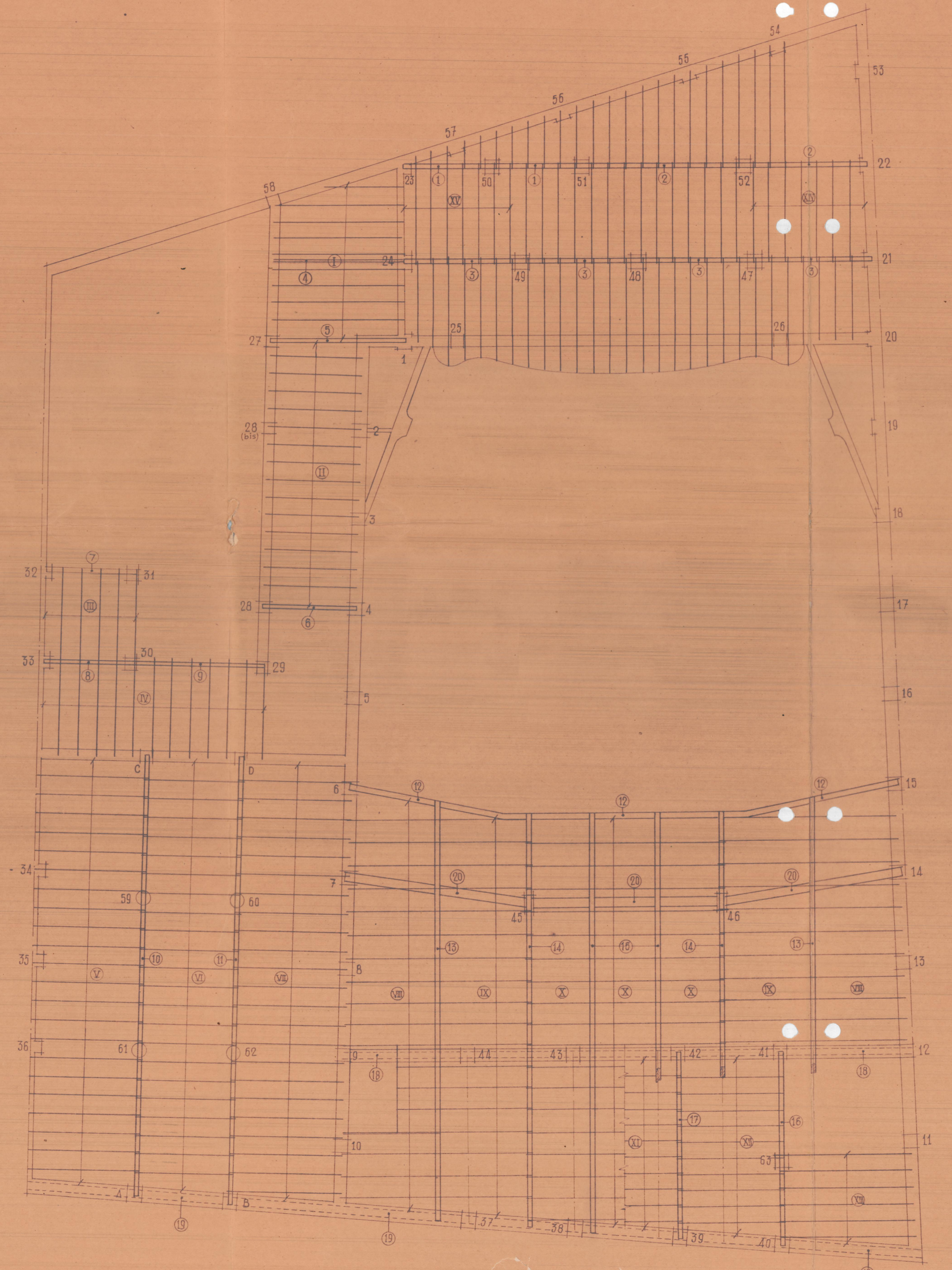
PLANTA DE ESTRUCTURA DE PISOS