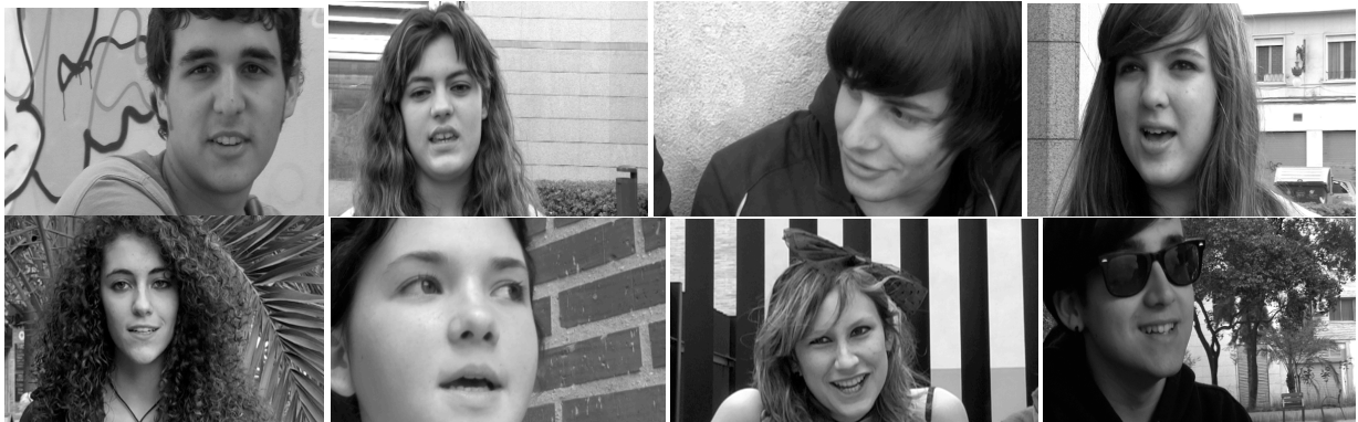
Fotogramas del video Nosotr@s hablamos . Algun@s protagonistas de las entrevistas en en el audiovisual

Nuestra creación audiovisual se decanta hacia la entrevista como metodología participativa y es por este motivo que hemos planteado un epílogo constituido únicamente por testimonios de l@s adolescentes que se presenta a modo de reflexión, partiendo de los discursos directos y motivados por la pregunta: “¿existe igualdad real en nuestra sociedad?”. Se trata aquí de ofrecer un marco de debate para visibilizar las discriminaciones y fomentar la exploración de nuevos modelos culturales de actuación y relación que favorezcan la igualdad, pero también de ofrecer una visión de empoderamiento, dinamizadora y positiva acerca de la posibilidad de alcanzar la igualdad en nuestra sociedad occidental a través del debate, la escucha, la reflexión y la motivación hacia el cambio del modo de pensamiento único, patriarcal y dominante.