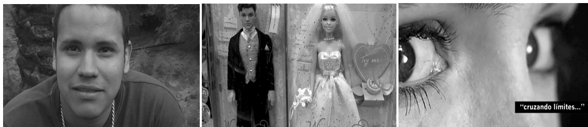
Fotogramas del video Nosotr@s hablamos

El amor es histórico y siempre es simbólico (...) Aprendemos ideologías amorosas, aprendemos los contenidos específicos del amor a través de mandatos, de normas, de creencias. Al vivir, cada persona trata de realizar el amor ideológicamente aprendido. En la realidad, la mayoría vive frustraciones amorosas porque casi nunca podemos realizar el imaginario amoroso al que estamos vinculadas (Marcela Lagarde, 2005).