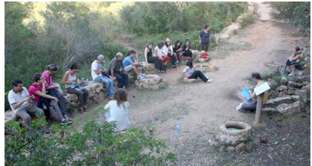
Imagen 6. Workshop con el artista Josep Ginestar en Gata de Gorgos

Por último, como culminación del proyecto cultural, se ofreció un workshop con el artista Josep Pedrós i Ginestar, cuya obra reúne poesía visual, fascinación por el paisaje y la espiritualidad sufi, vertiente mística del Islam. El taller se llevó a cabo en un paraje natural de la localidad de Gata de Gorgos (Alicante) donde, bajo la guía del artista, los participantes disfrutaron de una experiencia de contemplación más profunda a partir de la inmersión y del contacto no mediado con el entorno natural. Asimismo, pudieron enriquecer su sensibilidad artística, experimentando libremente con diferentes lenguajes plásticos e incorporando en su proceso creativo la vivencia física y espiritual del paisaje.