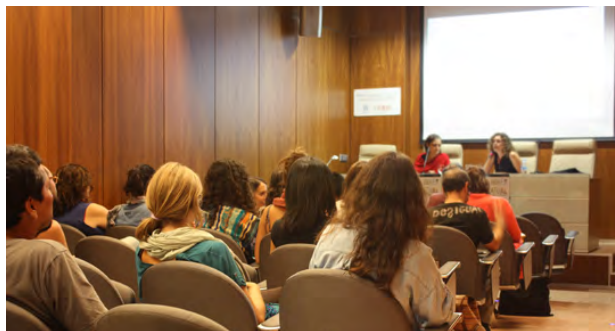
Imagen 4. Inner Nature , muestra de videoarte. Valencia, 2014.