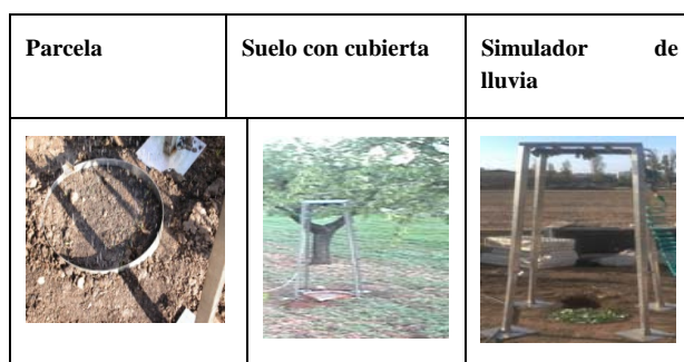
Figura 1. Detalle del simulador de lluvia y parcela utilizada.

La experiencia se realizó en un suelo rural de la zona de la Huerta de Valencia adicionando residuos obtenidos del arbolado de diferentes cultivos mediterráneos como cítrico, olivo y morera. Se utilizaron hojas y tallos procedentes de la poda de jardines urbanos que fueron triturados con una trituradora Viking GE345 con 2,2kW. Se utilizan 500 g de vegetal que se colocaran en la parcela del simulador para realizar cada experiencia.