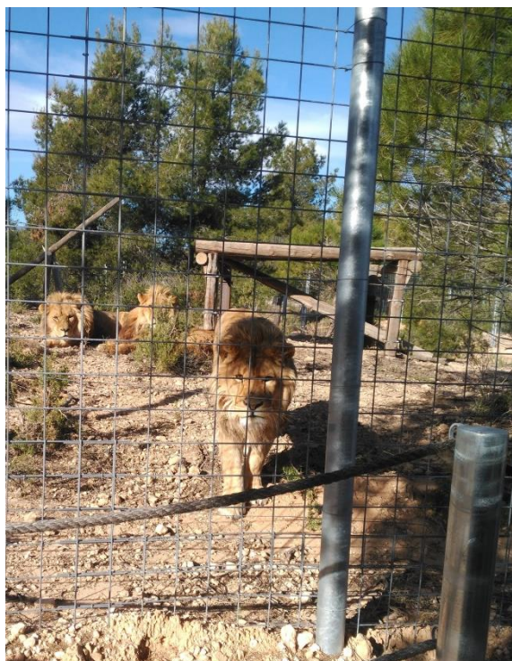
Imagen 8: AAP Primadomus centro de rescate Villena (Alicante). Fuente: Elaboración propia.

Cuadro 10: Análisis de los centros de rescate y recuperación. Fuente: Elaboración propia a partir de la fuente FAADA.