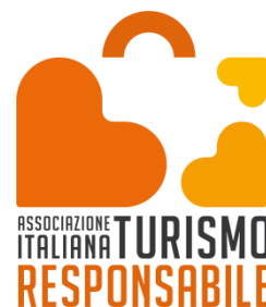
Imagen 4: Logo AITR.

Por otra parte, entre las organizaciones nacionales podemos encontrar: