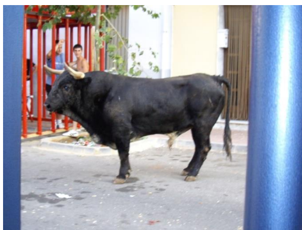
Imagen 9: Bous al carrer en las fiestas patronales de Simat de la Vall d'igna.

En lo referente a las tradiciones, el Ministerio de Educación, Cultura y Deporte realiza estadísticas anuales de asuntos taurinos y publica los resultados. Los de la estadística más reciente son del año 2016 y muestra que el número de festejos populares celebrados durante dicho año ascienden a 17.073 (Cuadro 13).