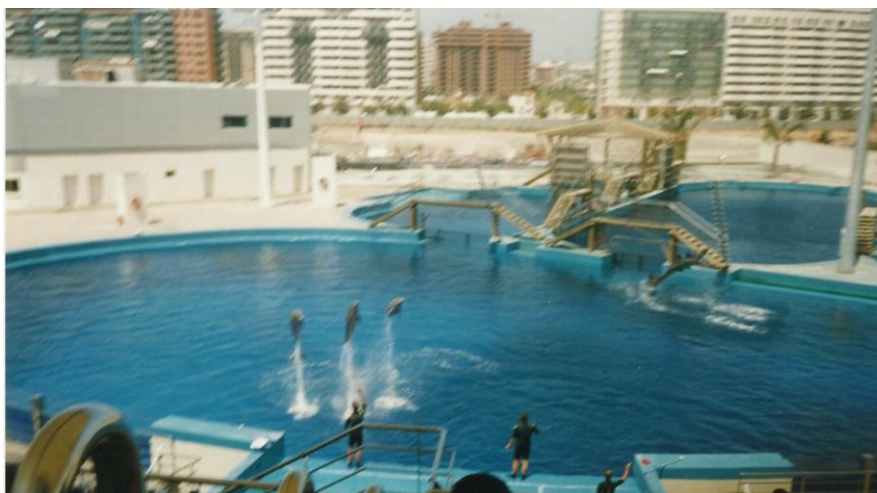
Imagen 10: Delfinario Oceanogràfic València.

Análisis de la práctica de actividades recreativas con animales en España y propuestas para la consecución de un turismo responsable.