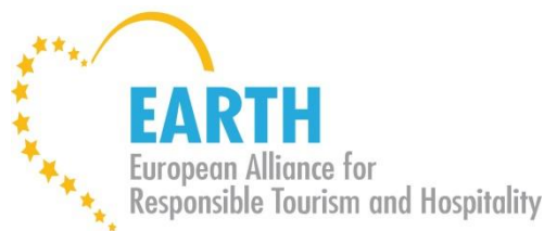
Imagen 2: Logo EARTH.