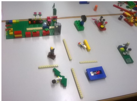
Imagen 2. Modelo creado con LSP.