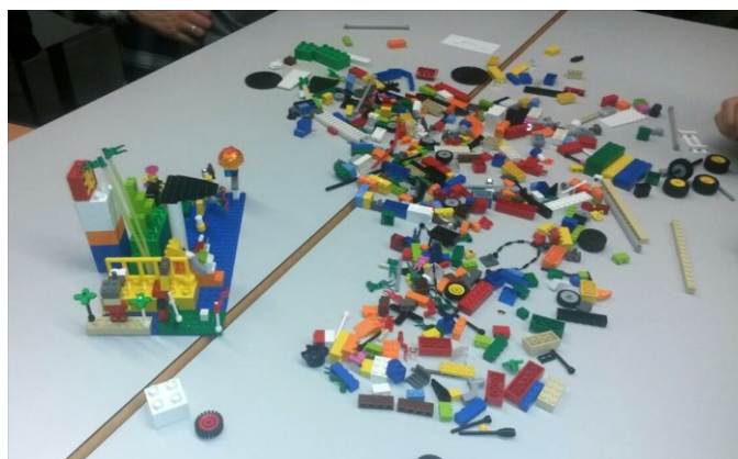
Imagen 1. Desarrollo de práctica con LSP.