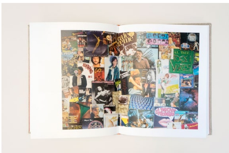
Figuras 7 y 8. Xufa (2020) Paco Llop. Portada de cartón cubierta con tela de saco y serigrafía e interior de la publicación. Diseño de Tapas Duras para Debacle Ediciones.. Finalista Premios ADCV 2024 en la categoría «Editorial: Libro y colección»