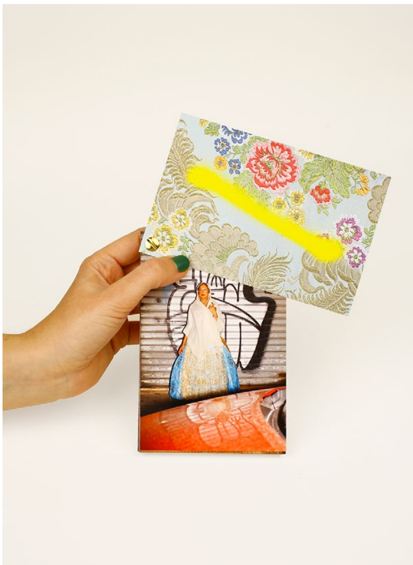
Figura 5 y 6. Graffitis y Falleras (2019) Ricardo Cases. 54 fotografías encuadernadas con tornillo, simulando un muestrario de telas. Barniz brillo en portada. Tapas Duras