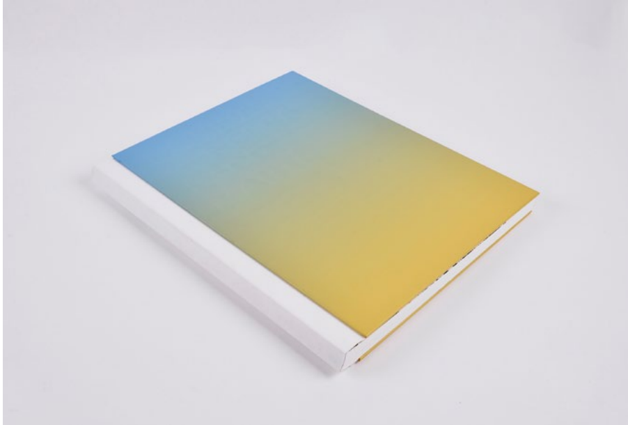
Figura 1. La vida sencera (2019) Paco Martí. Encuadernación holandesa con lomo de tela, impreso en Estudios Durero en la Jet Press 720S de Fujifilm, que procesa directamente archivos RGB sin requerir su conversión previa a CMYK, lo que permite reproducir una gama cromática más amplia. Diseño de Tapas Duras para Debacle Ediciones

En la era del fitness, las dietas proteicas, y el mantra de que el deporte es salud –la clave para la felicidad completa y deseada–, decidir terminar tu jornada laboral sin mover un músculo y, en su lugar, apuntarte a un programa de formación doméstica llamado CASA 1 , es un riesgo a contracorriente.