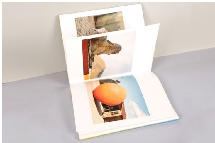
Figuras 2 y 3. La vida sincera (2019) Paco Martí. Diseño de Tapas Duras para Debacle Ediciones