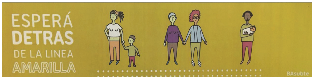
Fig. 5. Señalización que respeta la diversidad de identidades y conformaciones de familias