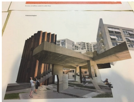
Fig. 4. Diseño de un complejo habitacional para mujeres víctimas de violencia de género