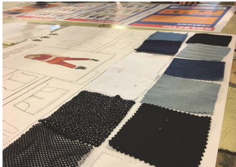
Fig. 3. Indumentaria con telas flexibles que se adaptan a los cambios corporales

Durante el cuatrimestre, lxs estudiantes presentan proyectos atravesados por perspectiva de género, en muchos casos se discuten los contenidos o trabajos de otras materias permitiendo analizar los parámetros que atraviesan las decisiones de diseños proyectuales. Los proyectos de lxs alumnxs son diversos: juguetes, cortos audiovisuales, piezas de indumentaria, diseños urbanísticos, propuestas de diferentes carreras que buscaron perspectivas de inclusión y discusión con los modelos heteronormativos. (Figuras 3, 4, 5 y 6).