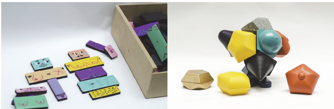
Fig. 6. Juegos para la enseñanza de educación sexual integral