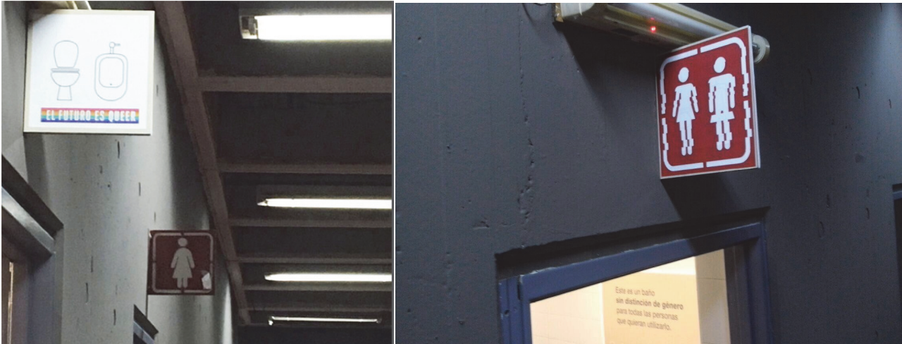
Fig. 7. La señalización del mismo cambia cada bimestre, con los diseños propuestos por el estudiantado

En esta línea y en relación a las investigaciones en torno a desnaturalizar los binarismos y discutir los espacios que lo reproducen, surge la necesidad de repensar en la Facultad de Arquitectura el diseño de los espacios como verdaderas “tecnologías de género” 3 . Desde este enfoque en el mes de Agosto de 2017 se inauguró (de manera oficial e institucional), el primer baño sin distinción de género en la Universidad de Buenos Aires. Según datos recogidos por Pablo Taranto “La violencia no siempre es solamente simbólica. Una encuesta de “clima escolar” realizada el año pasado por la asociación civil 100% Diversidad y Derechos, preguntó a estudiantes LGBTTTQ por los lugares que evitan en la escuela porque se sienten inseguros, y donde es más probable que sufran actos discriminatorios. En el primer lugar, el 43,8% señaló las clases de educación física. Después aparecen los baños: el 36,3% de ese colectivo evita ir al sanitario.” (Taranto, 2017). (Figura 7).