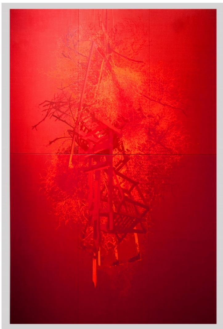
Fig. 3, A 180º / Hogueras. Técnica mixta sobre seda, 500 x 360 cm., 2016.

Del mismo modo, tampoco pueden ser traducidas por el lenguaje y la teoría, no van a ser estas herramientas útiles para su aprehensión. La comprensión intelectual se entiende sesgada e incompleta y va a impedir el acceso a la excepcionalidad inaprensible que las obras poseen. El exceso de argumentos alejaría al sujeto de la experiencia singular que el encuentro con la obra produce. Porque “el logos rompe el silencio de las cosas que carecen de lenguaje y luego fracasa al intentar expresar su ser inagotable en el concepto” (Safransky, 2009, p. 259).