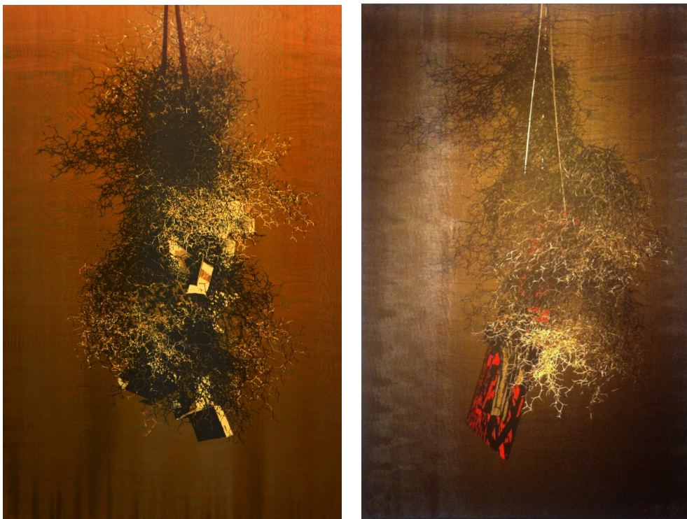
Fig. 5 y 6, A 180º / Hogueras . Técnica mixta sobre seda, 200 x 130 cm., 2016.

Es entonces cuando se establece una perspectiva desde la que se puede mirar la distancia existente entre lo sabido y lo percibido, entre la memoria y el acontecimiento. Distancia que no es más que el ejercicio de dejar que las cosas se aproximen y muevan hacia nosotros; que es también una capacidad de percibir sin explicar y de tomar conciencia sin definir. En este punto, ya puede percatarse de que nace una realidad que se manifiesta en el mismo punto en el que se extingue el conocimiento, allí donde la razón nunca le conducirá. María Zambrano identifica este estado en el poeta cuando éste no se queda en “la cosa conceptual del pensamiento sino que aborda la cosa complejísima y real, la cosa fantasmagórica y soñada, la inventada, la que hubo y la que no habrá jamás” (Zambrano, 2006, p. 22). Sólo en ese momento en el que el sujeto se expone desde su conciencia convertida en distancia, desprovisto de cualquier instrumento intelectual y frente a un mundo abierto del que no tiene certeza alguna, se pueden empezar a sondear las distintas propuestas que aquí se presentan; sólo bajo esas condiciones el sujeto se puede acercar y comprender lo que estas obras proponen (fig. 5 y 6).