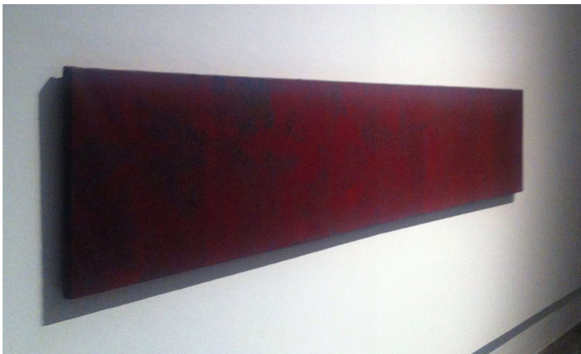
Fig. 7, La menor distancia . Seda erosionada, 300 x 60 cm. 2014

La obra ha de generar una desviación en el espectador para que el ver no se quede anclado a una visión lógica e indisputable, sino que pueda convertirse en un acontecimiento subjetivo, que le lleve a “una lejanía por más cercana que pueda estar” (Benjamin, 2003, p. 47). Una lejanía que, desde la distancia, se muestra para estar presente, para darse a conocer sin importar su distanciamiento, un lugar donde perderse y desorientarse para volver a encontrarse “a sí mismo puesto que nuestra desorientación de la mirada implica al mismo tiempo ser desgarrados del otro y de nosotros mismos, en nosotros mismos” (Didi-Huberman, 2006, p. 161). Sólo ante esa situación de extrañeza y desorientación puede tener lugar la experiencia íntima que interesa al artista: esa posibilidad del ver mediante la cual el sujeto se siente frente a un paradójico desasimiento que lo religa de nuevo al mundo. Una incertidumbre lúcida que es todo lo contrario a la certeza de un tener o de un saber.