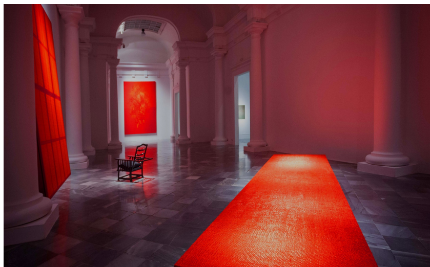
Fig. 1, vista de la exposición Que no cabe en la cabeza en el Centro del Carmen de Valencia (España).

“Nunca se ha establecido la relación entre lo que vemos y lo que sabemos.”