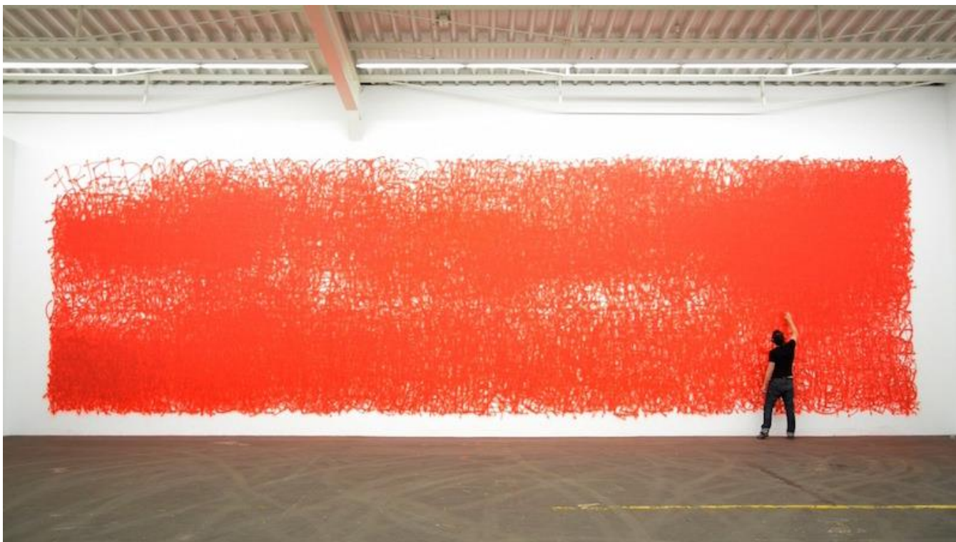
Figura 8. Momento de la performance Berlin says... perteneciente a la serie The city says... realizada por Nasan Tur, en el año 2013.

Se trataría de una imagen sin imagen que harían visible lo invisible (Castro Rey, 2012) o en algunos casos de una imagen difusa. En cualquier caso, el lenguaje y la comunicación son aspectos esenciales para las relaciones del ser humano y esta es la parte fundamental de la reflexión de Nasan Tur (Heinrich, 2011). Esta crisis del valor comunicativo que el artista plantea a través del borrado de la palabra como una superficie cubierta de pintura en aerosol es una metáfora de las dificultades que acosan a cualquier forma de comunicación. Rizando el rizo podríamos plantear que la sustracción tiene mucho que ver con la globalización, la normalización de la identidad y el descrédito de lo particular en lo cultural. Mientras que por otro lado, la adición estaría en relación con el mundo de la ficción, la virtualización del sujeto y el crédito a la ficción particular. Ambas formarían parte de un proceso de normalización y borrado de identidad que encamina al sujeto hacia una nueva cartografía quizá invisible, donde como planteaba Ralph Rugoff para su exposición Invisible: Art about the Unseen 1957-2012 , se hace más necesario pensar que mirar.