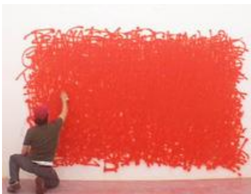
Figura 6. Momento de la performance Viena says... perteneciente a la serie The city says... realizada por Nasan Tur, en el año 2009.