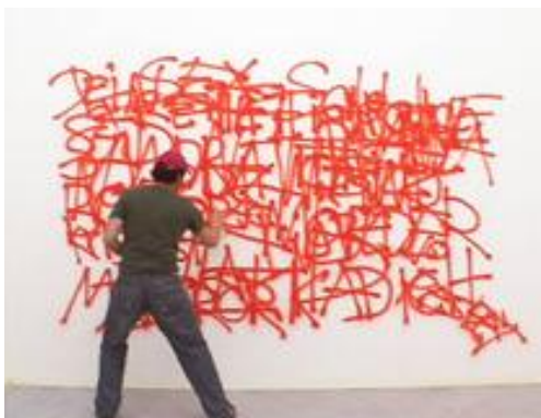
Figura 4. Momento de la performance Viena says... perteneciente a la serie The city says... realizada por Nasan Tur, en el año 2009.