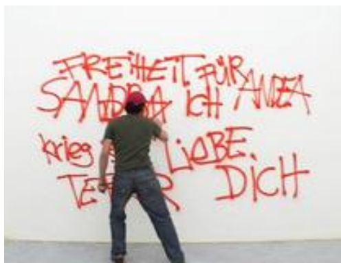
Figura 3. Momento de la performance Viena says... perteneciente a la serie The city says... realizada por Nasan Tur, en el año 2009.