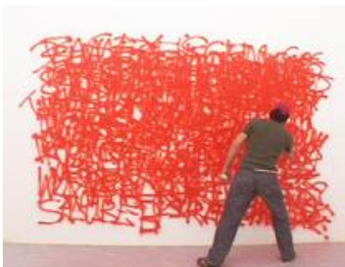
Figura 5. Momento de la performance Viena says... perteneciente a la serie The city says... realizada por Nasan Tur, en el año 2009.

Estas frases durante el proceso de realización de la obra se van superponiendo unas a otras en un tiempo muy veloz hasta que poco a poco se tornan una superficie roja ilegible. En la figura nº3 podemos observar como todavía podemos leer las consignas mientras que ya a partir de la figura nº4 la imagen comienza a ser ilegible. A través de la repetición y la reiteración podríamos interpretar como la calle se va quedando en silencio. Es el borrado de la palabra, pero no a través de la sustracción de la materia prima, si no a través precisamente de la adición.