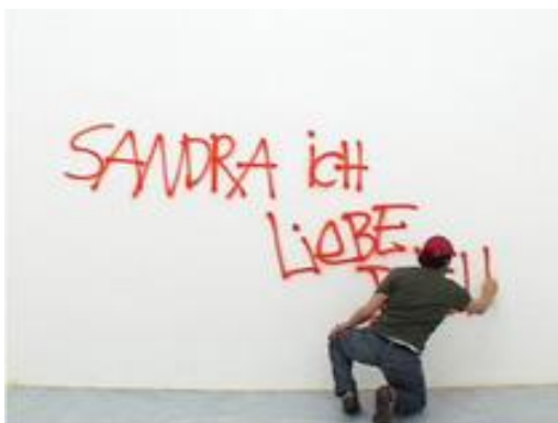
Figura 2. Momento de la performance Viena says... perteneciente a la serie The city says... realizada por Nasan Tur, en el año 2009.

Independientemente de esta reflexión central de denuncia nos gustaría llamar la atención como de un proceso repetido de superposición de imágenes se puede llegar al concepto de borrado y concluir como este mismo proceso se podría dar a la inversa. Sería aventurado plantear cualquier planteamiento en el arte sobre este concepto sin partir del Erased de De Kooning de Robert Rauschenberg (1953), sin embargo, y amparándonos en la primera definición que da la Real Academia Española de la lengua para la palabra, acción de “hacer desaparecer por cualquier medio lo representado” creemos que es perfectamente posible.