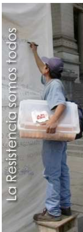
Proceso de El muro de la resistencia, 2003.

En conclusión, esta pequeña muestra de las prácticas artísticas colaborativas en la ciudad de Valencia nos descubre un tejido asociativo de carácter reivindicativo que protagonizó un momento determinado de la historia reciente de la ciudad, en algunos casos obteniendo resultados positivos como ha sido el caso del Botànic y el Cabanyal; por otro, negativos como la problemática de la ZAL en la Punta y otros ejemplos que han quedado recogidos en otras investigaciones recientes. La irrupción de estas plataformas no puede dejar de entenderse tampoco junto con las acciones artísticas que las acompañó e incluso visibilizó de forma eficaz, cabe destacar la participación de las instituciones universitarias de la ciudad como espacios de exposición, difusión y debate que han dado lugar a un amplio número de reflexiones teóricas y trabajos artísticos de gran valor patrimonial para Valencia y su población.