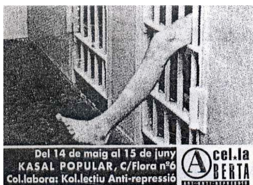
A cel.la oberta, autor desconocido, años del siglo XX.