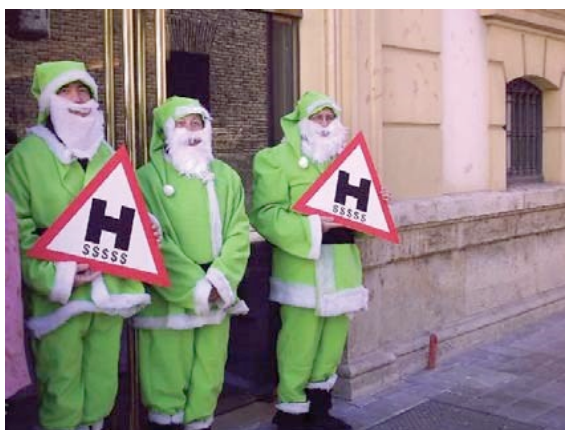
Papàs Noel a la puerta de una de las empresas implicadas, 1995.

Campaña de fin de año, padres Navidades a las puertas de las empresas de Lladró y de Miguel, en Expo-Hotel, en el Ayuntamiento de Valencia y al borde de los terrenos amenazados. Diciembre de 1995 hasta 2004.