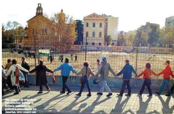
Abrazo reivindicativo, año 2002.

Cadena humana (abrazo) alrededor de Jesuitas. 15 de diciembre de 2002.