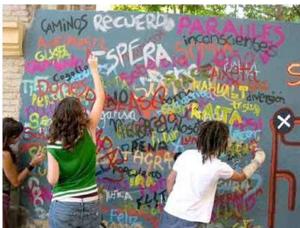
Trabajo colectivo en el mural del barrio de El Carme, 2003.