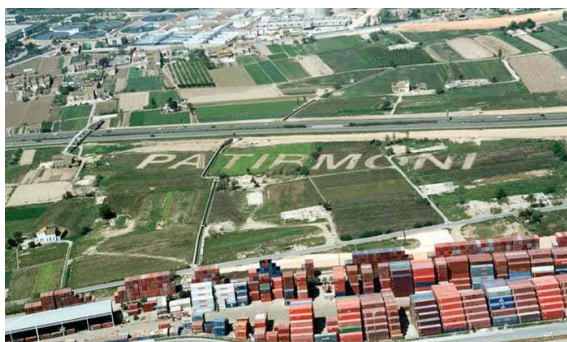
Imagen aérea de la acción Patirmoni, año 2003.

Fue una acción artística efímera, coordinada por el creador catalán Frederic Perers, que combinaba las palabras y la tierra, la fuerza de su significado y la energía de la Huerta de la Punta que las contenía. Una especie de poesía visual a gran escala escrita sobre la Tierra. La plataforma Per l'Horta organizó esta acción artística como homenaje a esta partida de la Huerta de Valencia y su gente, cuando la destrucción de La Punta era inminente. Se hizo una serie de 100 fotografías aéreas numeradas y firmadas por Frederic Perers, que documentan la acción. SUFRIR + PATRIMONIO = PATIRMONI 6 .