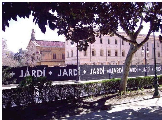
Jardí + Jardí +... año 2000.

Exposición Un jardín de arte en una esquina de los terrenos de Jesuitas, con 6 cuadros de 8 x 3 m. 27 de marzo de 1999.