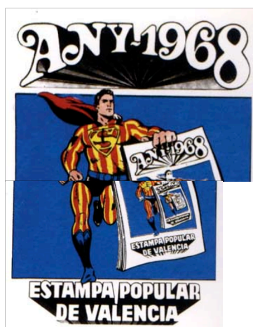
Estampa Popular, portada del calendario de 1968.

Se intenta atraer a un gran número de público no específico para dar visibilidad al problema, estas acciones de carácter artístico y reivindicativo han tenido una larga presencia a lo largo de los años setenta y ochenta en Valencia, y como luego veremos se continúan a finales del siglo XX y principios del XXI. Algunas de estas manifestaciones críticas podemos encontrarlas ya en Valencia, en los años sesenta y setenta con la formación del grupo gráfico Estampa Popular 1 el que producía una serie de calendarios de influencia pop pero sus ilustraciones reflejaban una manera de ver la sociedad franquista crítica y sarcástica.