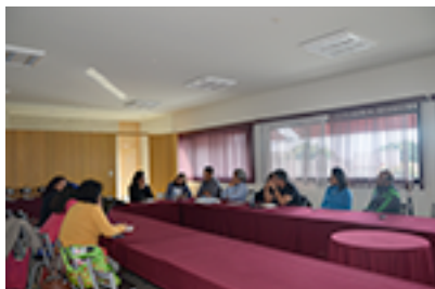
Ilustración 2: Reunión académica de los miembros de red.