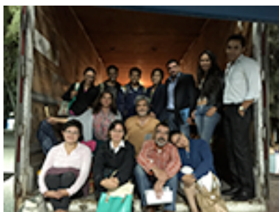
Ilustración 4: El viaje de los cantores (2015)