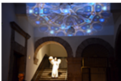
Ilustración 3: Espectáculo multidisciplinario Peregrino (2014)