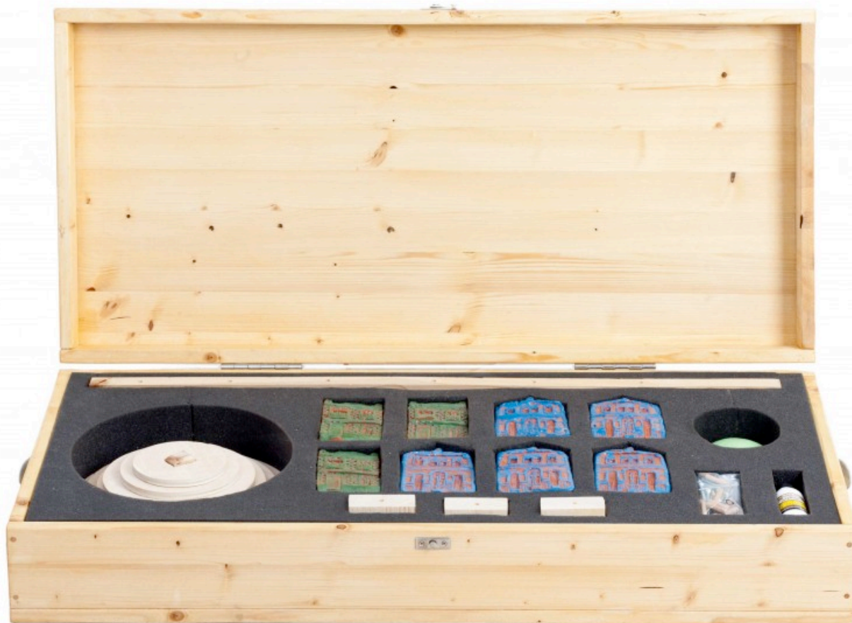
Ilustración 6. Caja con las piezas para montar la escultura “Cabanyal 1641”. Construye tu propio edificio puntero con un barrio histórico! . 7