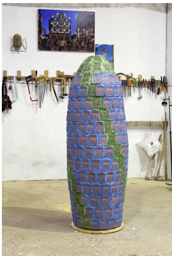
Ilustración 3. Escultura terminada en el taller.

“Cabanyal 1641”. El trabajo presenta una recolección de las casas que iban a ser expropiadas y derruidas en el Cabanyal, una de las luchas vecinales más fervientes que se ha vivido en Valencia desde hace más de una década, y que en la actualidad continua vigente aunque se haya transformado hacia otras cuestiones vinculadas al neoliberalismo. El número se debe a las 1641 viviendas expropiados, y contando con que sólo 1 de cada 3 familias que iban a ser reubicadas en pisos de nueva construcción, conformarían las 533 familias presentes en la escultura. Divididas en 53 casas unifamiliares y 240 viviendas que acogen a dos familias. Con esto construimos una escultura de 180 cm, relativa a escala 1:2000 a la longitud total de la Avenida de Blasco Ibáñez después de la modificación propuesta por PERI, Pla Especial de Reforma Interior, elaborado por AUMSA por encargo del Ayuntamiento de Valencia en época de gobierno del Partido Popular. En la eterna confrontación entre la conservación del patrimonio o el desarrollo especulativo, este plan suponía la destrucción de un conjunto histórico protegido de la ciudad, declarado Bien de Interés Cultural (BIC) en 1993.