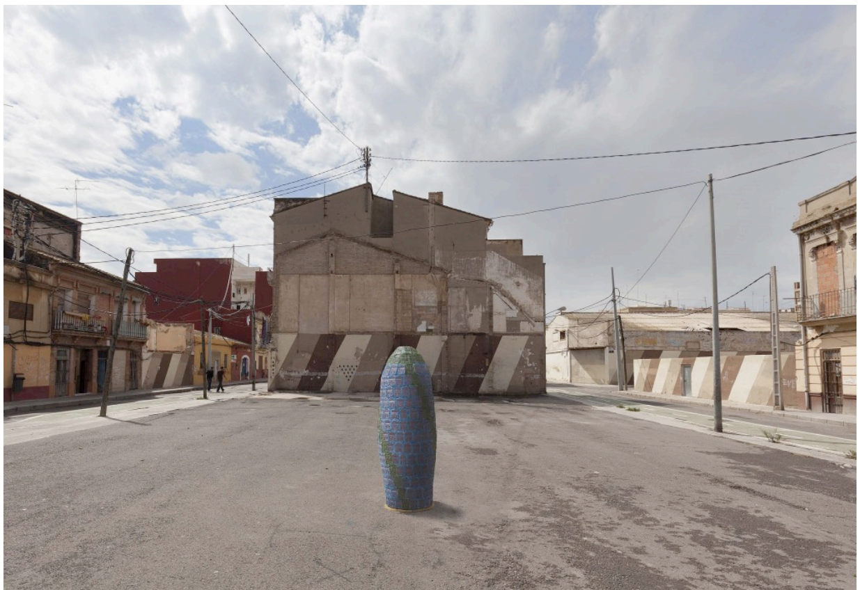
Ilustración 4. Intervención pública de la escultura en el Cabanyal (Valencia).