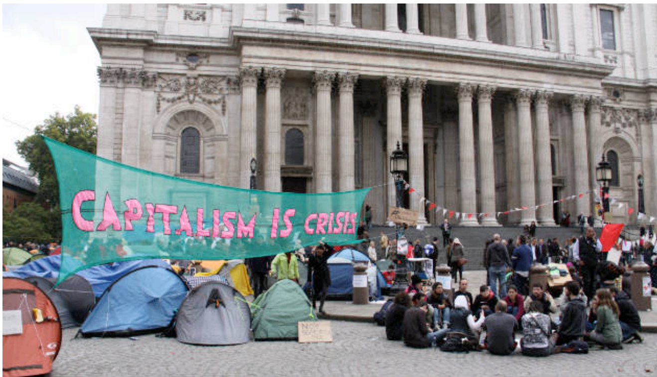
Ilustración 2. La acampada, asambleas y manifestantes de “Occupy London” durante las protestas en la St Paul’s Cathedral.

La autora cita muchas plazas más que en definitiva tienen un punto en común. A pesar de estar abiertas en la ciudad se comportan como centros comerciales cercados. Su concepción va encaminada a una forma de vida que se resume a comprar o trabajar, de aquí que los usos establecidos sean exclusivamente oficinas, tiendas y restaurantes. La vida diaria de los usuarios ya está programada sin necesidad de pensar en otras opciones o acciones espontáneas. La arquitectura que las rodea es genérica, concebida y construida a gran velocidad, donde el muro cortina y el aire acondicionado es omnipresente, y se acerca a la definición de Ciudad Genérica de Rem Koolhaas. Por otro lado, la libertad que el espacio público ha ofrecido tradicionalmente se queda en estos casos en una promesa, la misma que ofrece el neoliberalismo donde se confunde la libertad personal con la libertad empresarial.