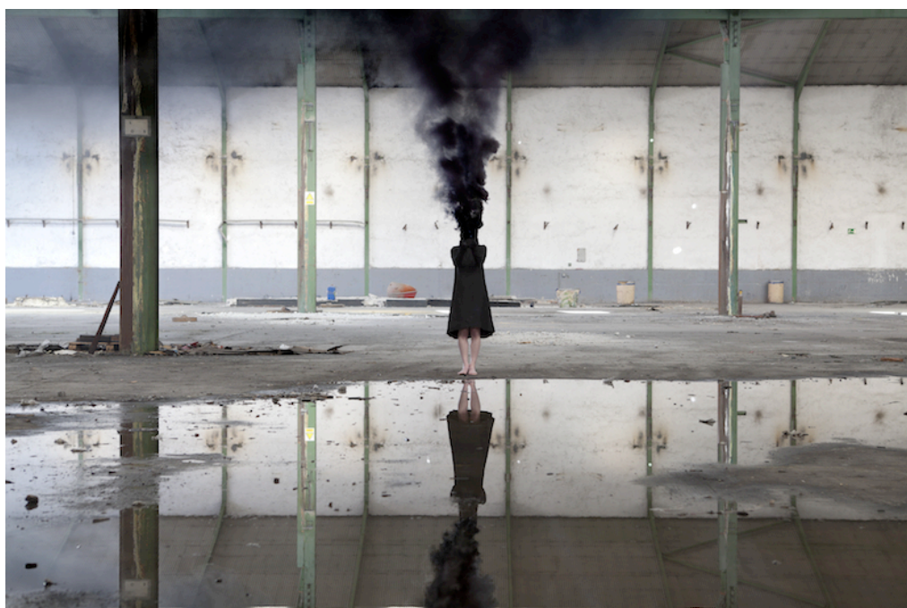
Ilustración 1. Devastación VIII , 2015. Tintas pigmentadas en papel baritado sobre Dibond, 100 x 150 cm.

Me convierto en humo, soy mi propia hoguera, el cuerpo se transforma en una columna de humo ( Devastación VIII, IX y X ) como símbolo de la combustión del dolor que devora al doliente. Aunque a veces esta combustión es una nueva forma de existir, una explosión y un expandirse para ser y tomar posición.