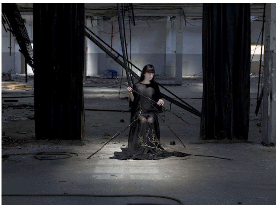
Ilustración 4. Devastación IV , 2015. Tintas pigmentadas en papel baritado sobre Dibond, 100 x 136 cm