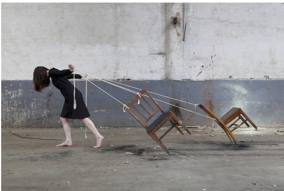
Ilustración 2. Devastación II , 2015. Tintas pigmentadas en papel baritado sobre Dibond, 100 x 150 cm.