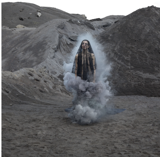
Ilustración 3: Devastación X , 2015. Tintas pigmentadas en papel baritado sobre Dibond, 120 x 120 cm.

Son escritos vivenciales, fragmentos de mis diarios de trabajo. Son herramientas para la reflexión e introspección, textos que tienen la intención de captar a modo de instantánea imágenes fugaces que aparecen como visiones.