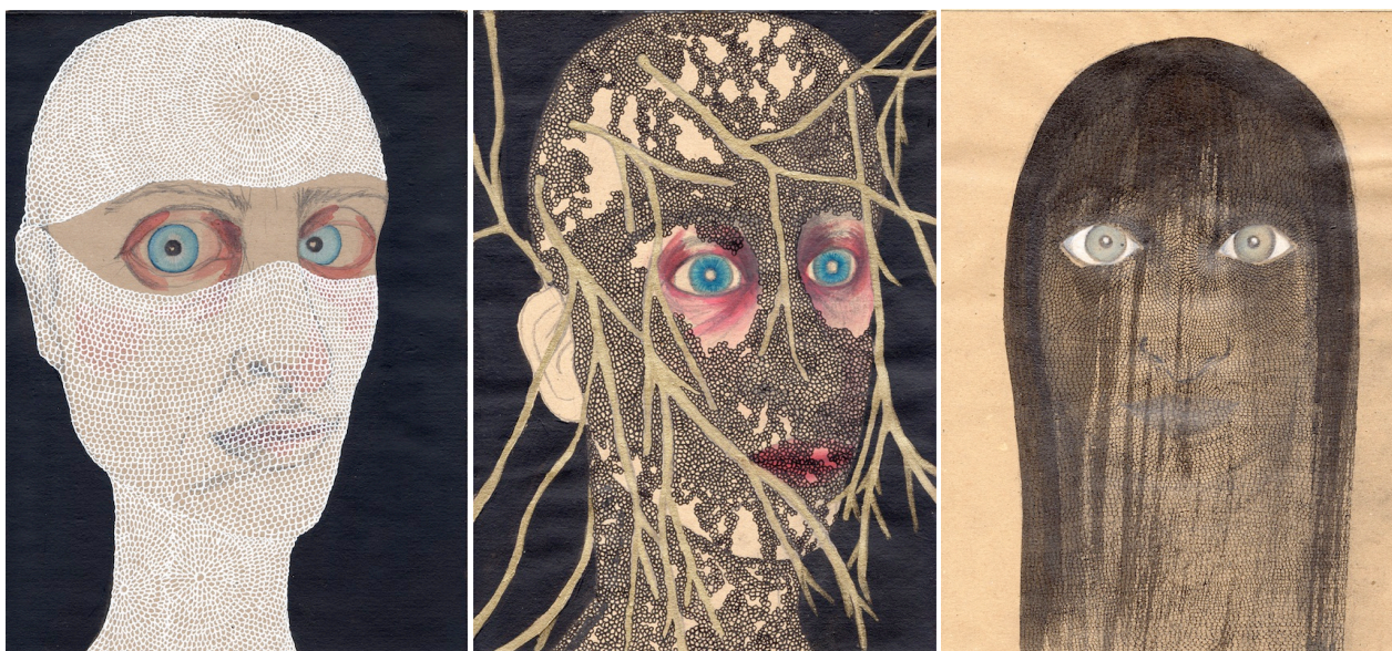
Ilustración 5. Velada XVI, XII, III , 2015. Dibujos, técnicas mixtas, 29,7 x 21,5 cm.

El dolor es un camino sin retorno en el que una vez producido no hay marcha atrás, sabemos que el dolor puede ser aliviado, maquillado o transformado. Sobre este pilar solo queda asirse a la transformación o al dejarse llevar por el dolor. Se puede elegir cualquiera de estos caminos, en mi caso elegí la transformación, la aceptación de los cambios. Y en este renacer que surge de la curación coincide con los dibujos de autorretratos en los que la labor de dibujar trasciende al propio hecho de la representación para convertirse en una práctica casi de mantra y meditación.