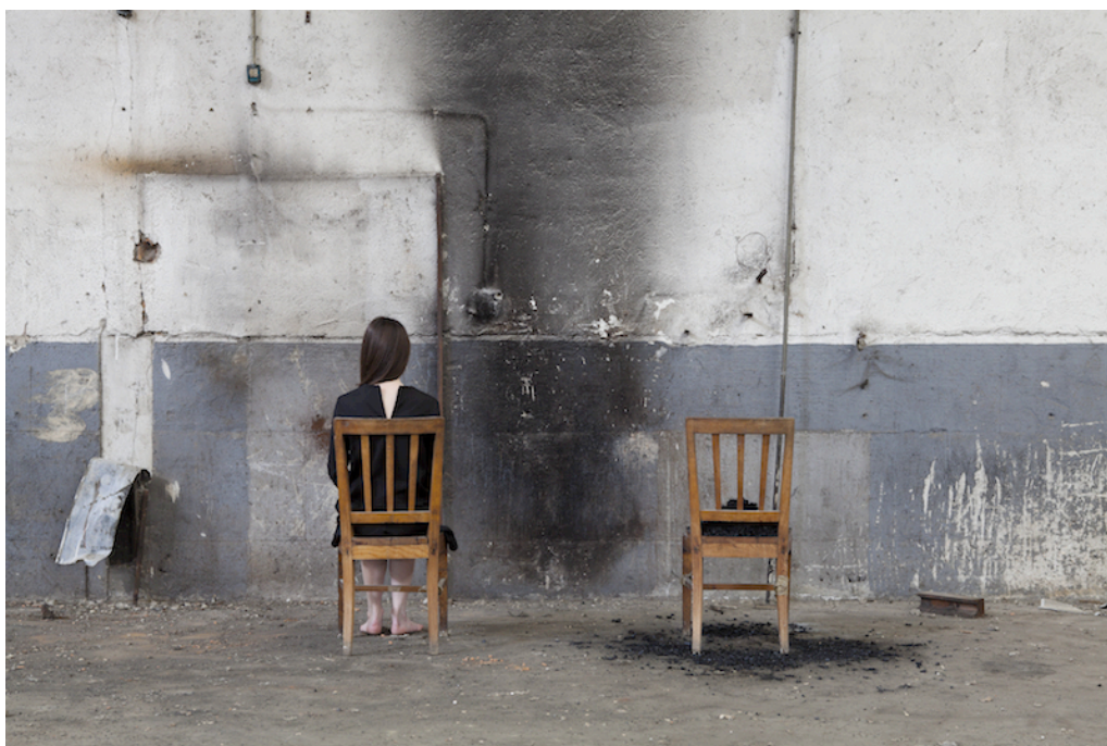
Ilustración 3: Devastación II , 2015. Tintas pigmentadas en papel baritado sobre Dibond, 100 x 150 cm.