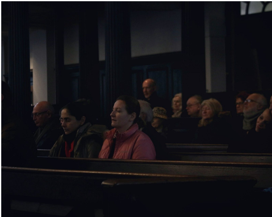
Figura 5: fotografía propia. Interior, iluminación natural.