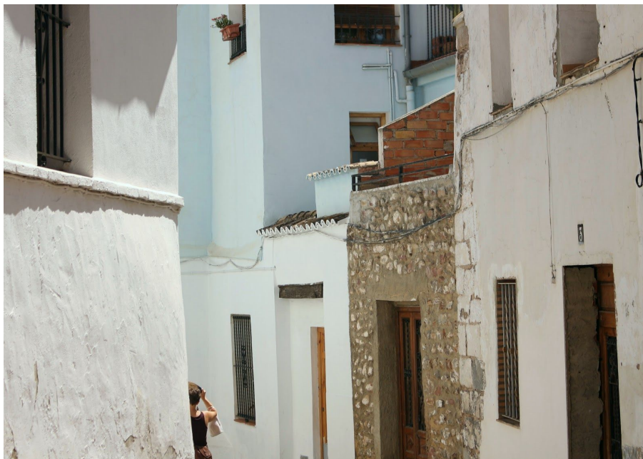
Figura 1: fotografía propia. Plano general.

No se busca simetría en los planos, sino un encuadre correcto pero lo más natural posible. Tampoco se utilizan filtros en la cámara, ajustando en el momento del rodaje el balance de blancos. En interiores, colocar a los actores cerca de ventanas u otros puntos de luz natural. Esto implica necesariamente tener que ajustar el diafragma mientras se está rodando. Los actores pueden, si esto beneficia a la narrativa de la secuencia, entrar de la penumbra al espacio iluminado de manera natural. Evitar la sobreexposición de la imagen, buscando también tonalidades cálidas.