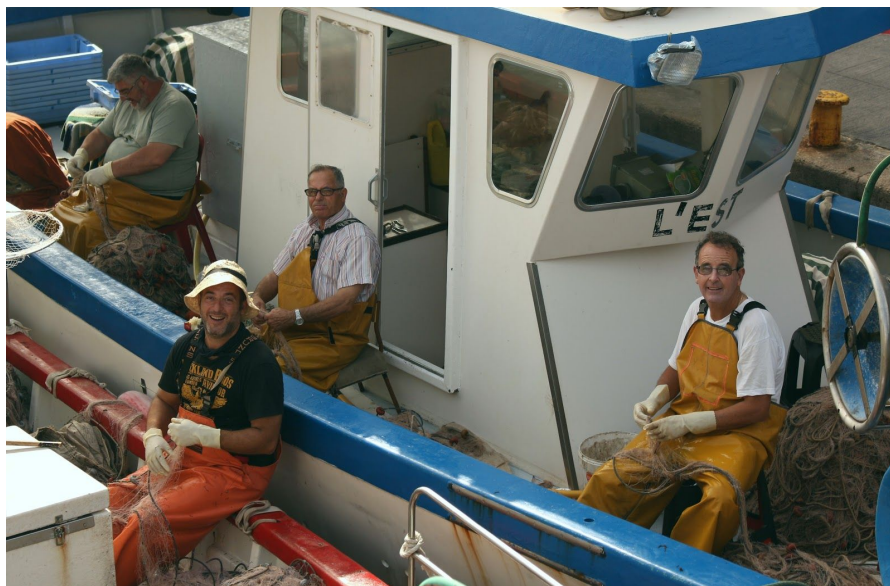
Figura 3: fotografía propia. Picado, interacción con el protagonista.