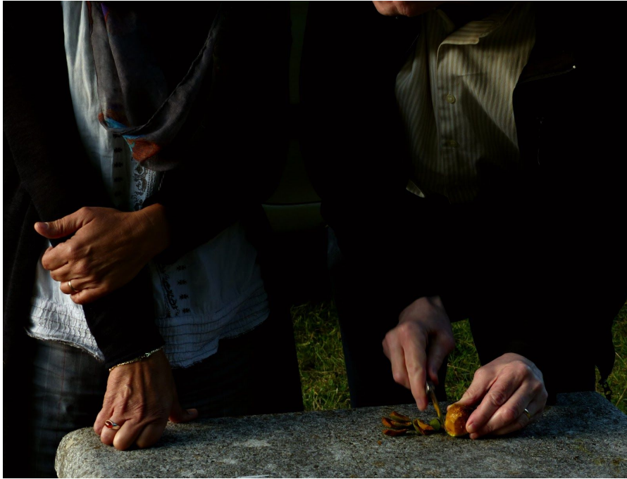
Figura 4: Plano corto, detalle manos. Luz natural.