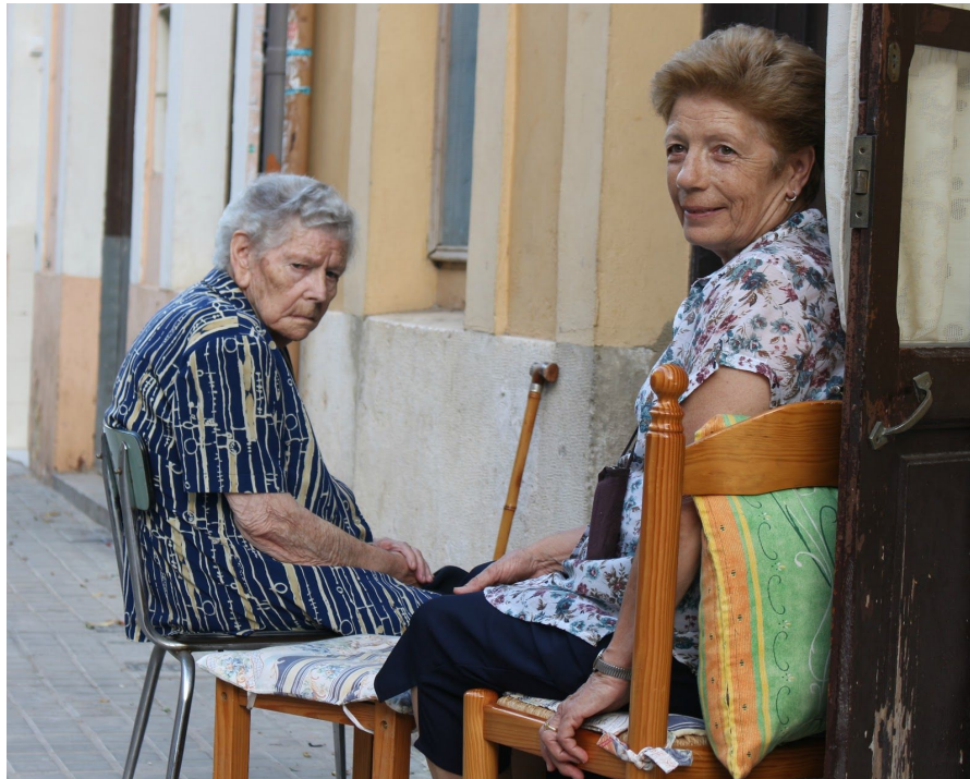
Figura 2: fotografía propia. Plano medio, interacción con el protagonista.