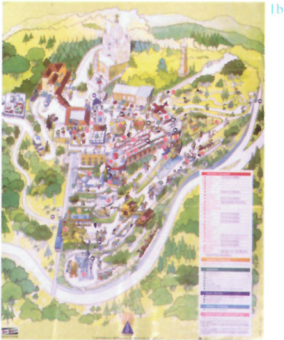
1b. El Tibidabo. La Montaña Mágica Barcelona. s/f

El pasado 29 de agosto, en las páginas del International Herald Tribune , un inocente artículo sobre el atractivo turístico de Carcassonne llevaba el siguiente título: Better Than Disney: Carcassonne, the Fortress on a Hill 1 . Se trataba de un título provocativo: poner en paralelo el atractivo turístico de los grandes parques temáticos del ocio post-moderno con uno de los lugares ejemplares de la restauración y conservación de monumentos históricos. Aun cuando sean bien conocidas las polémicas sobre la pertinencia de la restauración de la villa medieval de Carcassonne realizada a mediados del siglo XIX por el joven Viollet-le-Duc, no es menos cierto que resulta sorprendente el paralelo entre la autenticidad arquitectónica y urbana de una parte importante de las murallas y los edificios de la ciudadela cátara, y los conjuntos deliberadamente ficticios, simuladores, de Disneyland, Disneyworld o Eurodisney. Pero no es menos cierto que si pensamos en el Partenón de Atenas, en la Alhambra de Granada, en Carcassonne o en el Mont Saint Michel, en el Coliseo de Roma o en la Ciudad de Venecia advertimos que la percepción y el consumo contemporáneo de estos lugares tal vez no estén tan alejados de la percepción y el consumo que hoy se ofrece a las multitudes turísticas trashumantes que acuden también masivamente a los actuales Parques Temáticos.