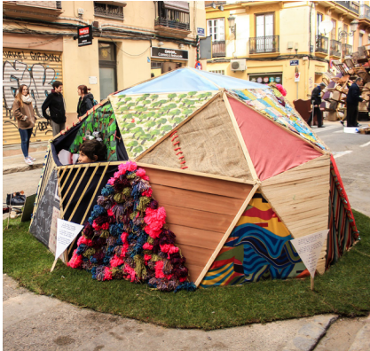
29. Falla infantil de costat