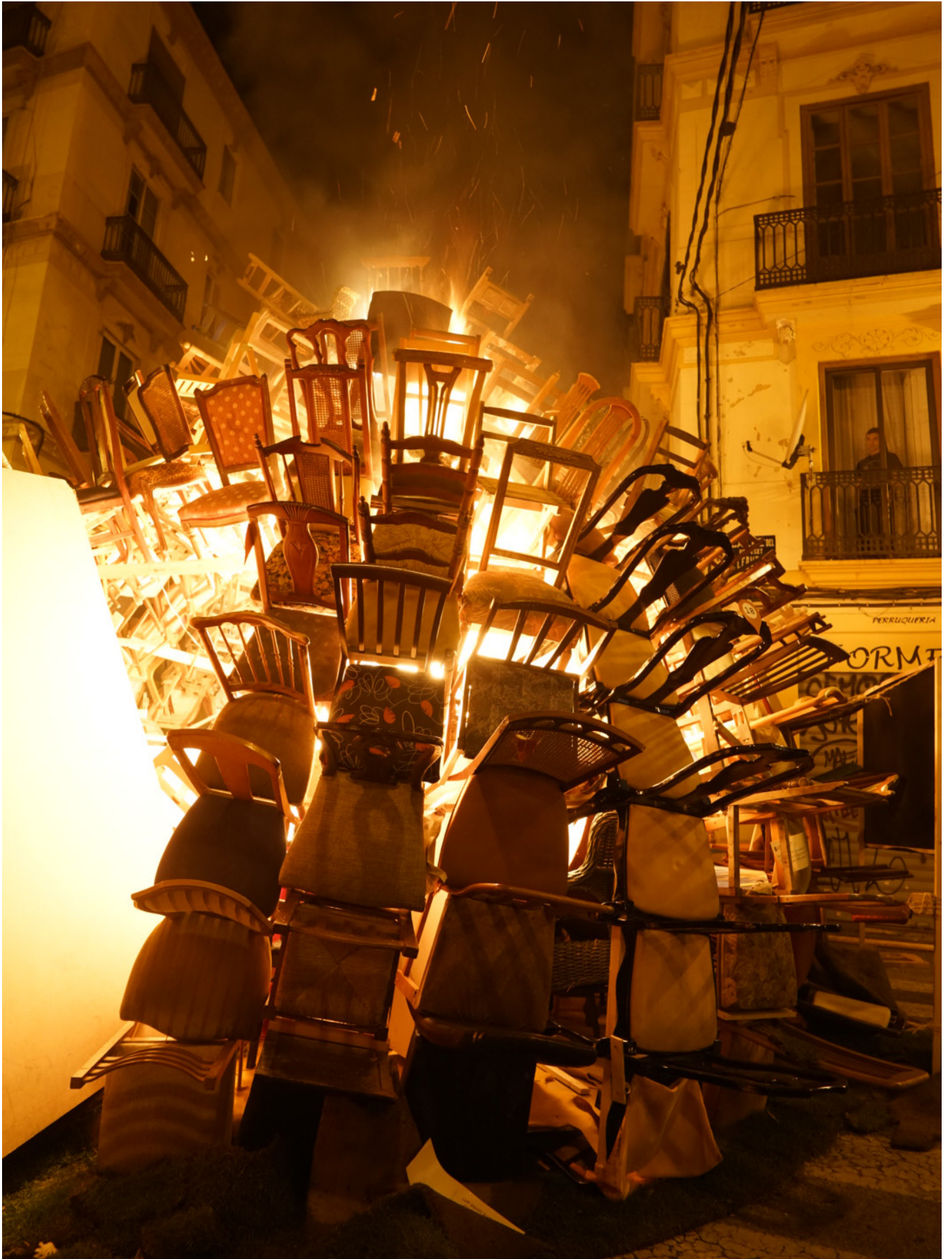
45. Foto de la cúpula de cadires la nit de la cremà. Perspectiva 2