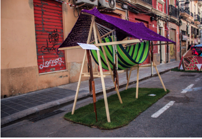
6. Escena sisena. #sensoriART

Ací el que preteníem era mostrar que l'art no solament és visual, sinó també es pot relacionar amb altres sentits, com l'oïda, com ben tots sabem, o fins i tot el tacte. Era una hamaca coberta per una tela on et podies tombar, i en obscuritat, sentir diferents fustes que penjaven de fils.