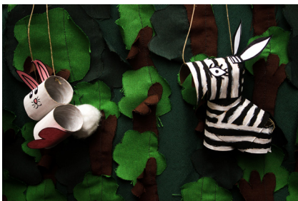
31. Detall del guinyol dret