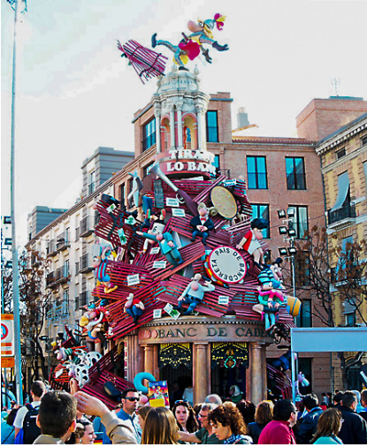
33. Falla "Tirant Lo Banc", Na Jordana, 2014 per Ortifus