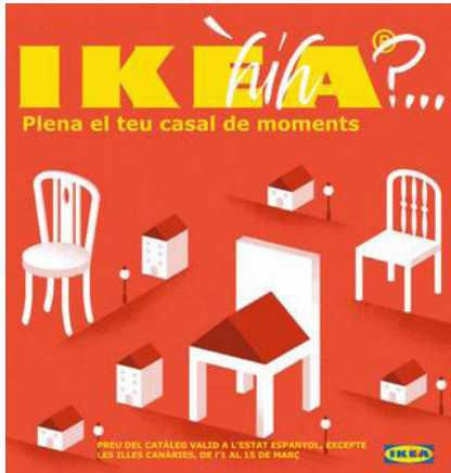
39. Portada del llibret de la Falla Borrull-Socors.

I al costat d'aquest text vam posar aquest altre per a complementar-ho: