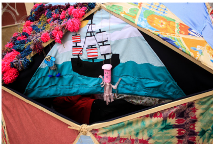
30. Detall del guinyol esquerre