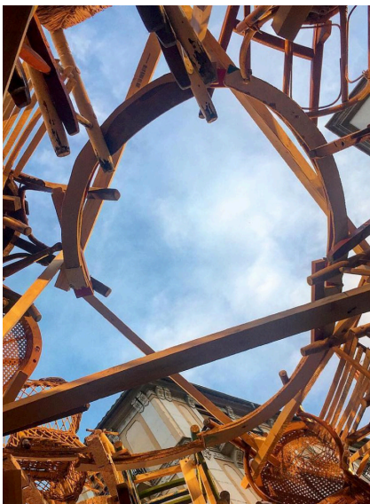
42. Vista a l'exterior desde l'interior de la cúpula.

Va ser una plantà molt llarga, doncs va durar dies, però gràcies a la preproducció que havíem fet de la falla, a l'una del matí del dia 16 la nostra cúpula de cadires ja estava acabada.