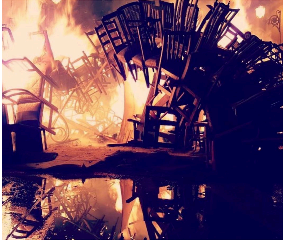
44. Foto de la cúpula de cadires la nit de la cremà. Perspectiva 1

La cremà va ser un moment veritablement emotiu. En realitat, sempre és un moment emotiu, cada falla és única i especial, i vius amb ella una setmana molt intensa, però enguany va ser molt diferent.