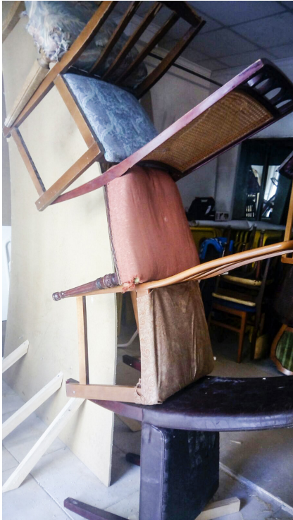
37. Columna en procés al nostre baix.

prada plantarem l'estructura base al tombe. L'estructura base es componia de la part superior de la cúpula i quatre columnes de dotze cadires. Per a pujar-la necessitarem vint persones.