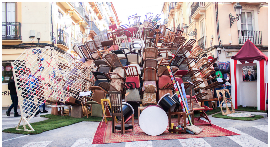
23.Escena vint-i-u. #sonARTfestival

La música també és un art, i és per això que volguérem crear aquest espai músic-interactiu on la gent poguera participar. Tots els instruments els vam fer de materials reciclats o reutilitzats i a la fi va sorgir coses com percussió i alguns instruments de vent i corda.