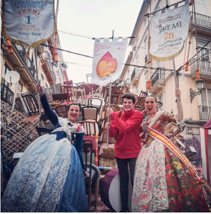
50. La Fallera Major, la ex-presidenta i un dels membres de l'equip de treball amb els premis, darrere, la falla.

La nostra comissió és humil i xicoteta, per la qual cosa és tradició veure els premis tots junts en la tele de nostre reduït casal, però des que som nosaltres mateixos, els fallers de tota la vida, els que fem la falla, el moment és encara més especial.