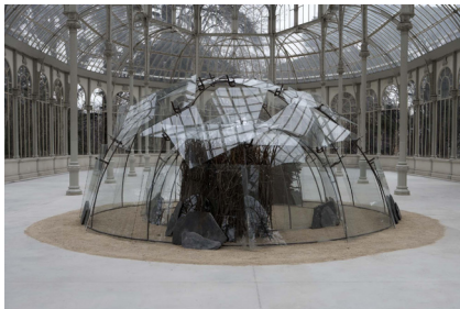
36. Igloo del Palacio de las Alhajas, Mario Merz, en el Palacio de las Alhajas, Madrid, any 1982

En 1968 és la primera vegada que veiem la forma més representativa de Merz, l’iglú, que els utilitzava com a metàfora del pensament buit de l’època i dels altres artistes, nòmades i passatgers d’un art canviant i evolutiu, sent l’iglú la cèl·lula originària de l’hàbitat nòmada humà.