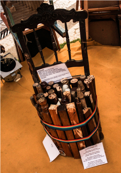
38. La cadira de moltes potes, presentada a l'exposició del ninot celebrada al museu Príncep Felip.

D'altra banda, les escenes van ser bastant més senzilles de construir, ja que la majoria d'elles no havien d'albergar a ningú dins i amb les grapes de 7cm vam poder aguantar totes les estructures. La diferència fonamental per a diferenciar quan usar grapes i claus i, quan caragols era si en l'estructura havia d'entrar gent o no.