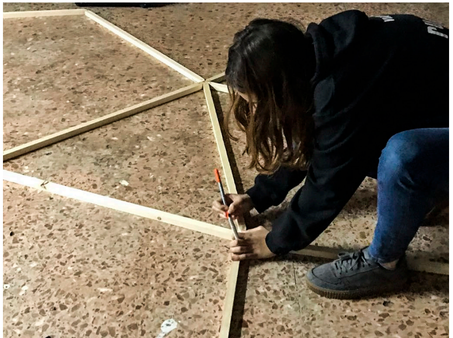
28. Detall càlcul angle llistons

Els llistons A, que componien els triangles A eren els triangles que formaven la base del dom, i per tant els B, eren els que donaven la forma al dom, creant al seu torn cinc pentàgons.