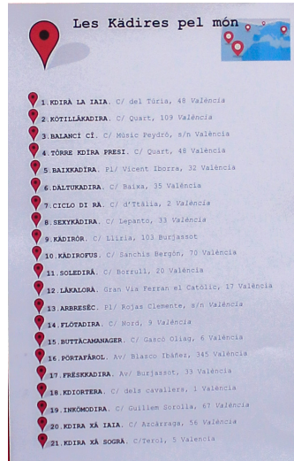
24. Llistat de contenidors.