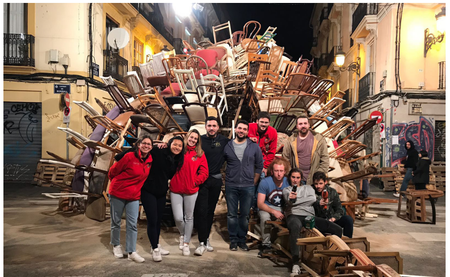
43. Part de l'equip de joves que estigué els dies de la plantà.