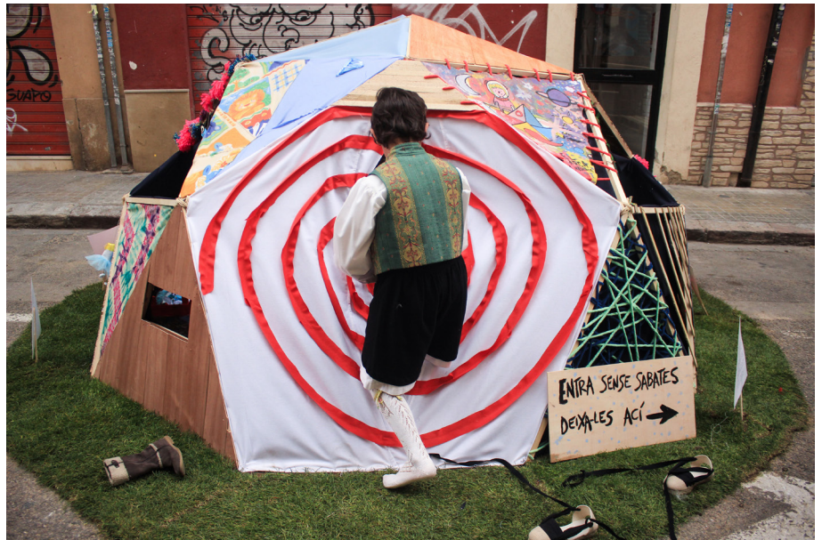
26. Falla infantil de front.

Conjuntament a la falla gran, vam fer la falla infantil. Una cúpula a menor escala que també estava plena d'art. Per a nosaltres la falla infantil ha de ser de la pròpia comissió infantil, és a dir, un espai on ells puguen jugar, viure i sobretot, aprendre sobre la temàtica de la falla.