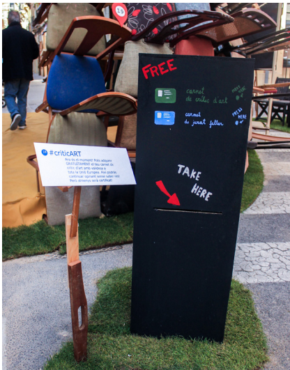
18. Escena divuit. #criticART

Ara és el moment! Pots adquirir GRATUITAMENT el teu carnet de crític d'art amb validesa a tota l'Unió Europea. Així podràs continuar opinant sense saber res! Però al menys serà certificat!