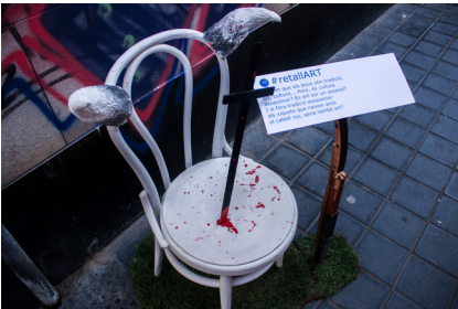
11. Escena dècima. #retallART

Aquesta escena estava relacionada amb la número 8. Els bous són una festa tradicional, i per a alguns, cultural, però on està la relació entre cultura i tortura? Fins a on arriba el límit de l'art quan està la mort d'un ésser viu pel mig?. Era una cadira blanca amb unes banyes de bou, taques roges que simbolitzaven sang, i un ganivet clavat.