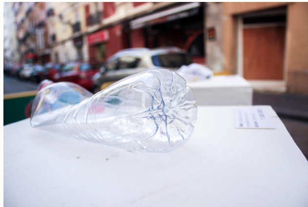
21.Escena vint. #consumiART