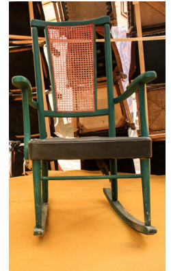
1. Les tres cadires components de la primera escena. #a100ART

Aquesta escena es componia per diverses cadires de diferent vellesa situades a l'interior de la cúpula de forma expositiva, amb açò preteníem parlar de l'evolució de l'art fent la comparació amb l'evolució de les cadires.