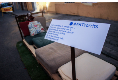
12. Escena onze. #ARTvorrits

Digues tot el que no t'atreveixes a dir. A cau d'orella hi ha un espai lliure de fum, on ningú t'exclou per 100ir diferent a la resta.