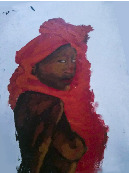
10. Escena novena. Detall pintura part Africana #diversitART

El concepte d'art no és el mateix per a tots, canvia depenent de la teua nacionalitat, les teues arrels o la teua cultura, depèn de com hages sigut educat, o fins i tot quins dibuixos has vist de xicotet. Açò és el que volíem realçar en aquesta escena, el concepte d'art és molt més extens del que solem apreciar i varia molt segons on et trobes. L'escena era una paret amb motius multiculturals pels diferents continents.