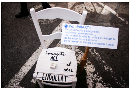
2. Escena segona. #endollARTs

En aquesta escena parlavem de l'endollisme en l'art i en la societat. Es tractava d'una cadira blanca amb un buit per a un endoll, i en el centre, escrit amb lletres negres "Connecte ací al seu endollat".