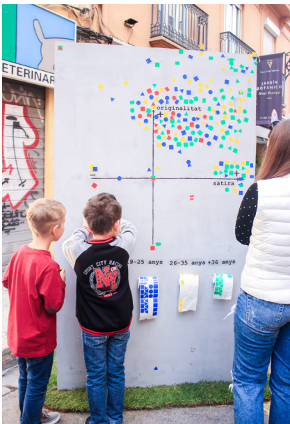
16. Escena setge. #votART al graficART

Enguany la comissió va guanyar el primer premi de llibret de la ciutat de València. Fer un llibret també és art i disseny, per açò vam voler imprimir en gran dues pàgines del nostre llibret guanyador, perquè per a nosaltres açò també és art.