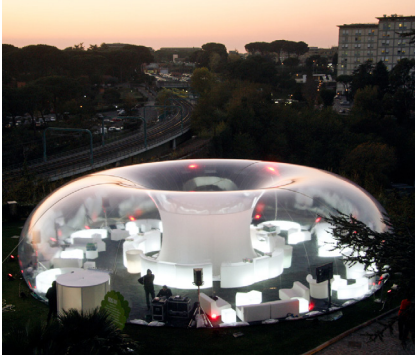
35. Medusa de Canevacci en Showcase for Radio Dimensione Suono , Rome, 2009 – 2013.

xer per pura supervivència. “¿Cómo calentar los 2.000 m 2 de la nave que acababa de alquilar en Berlín con unos colegas sin dejarse sus escasos ahorros en el intento? «Había que recortar metros cúbicos como fuera. La manera más simple fue crear una burbuja en su interior». 5