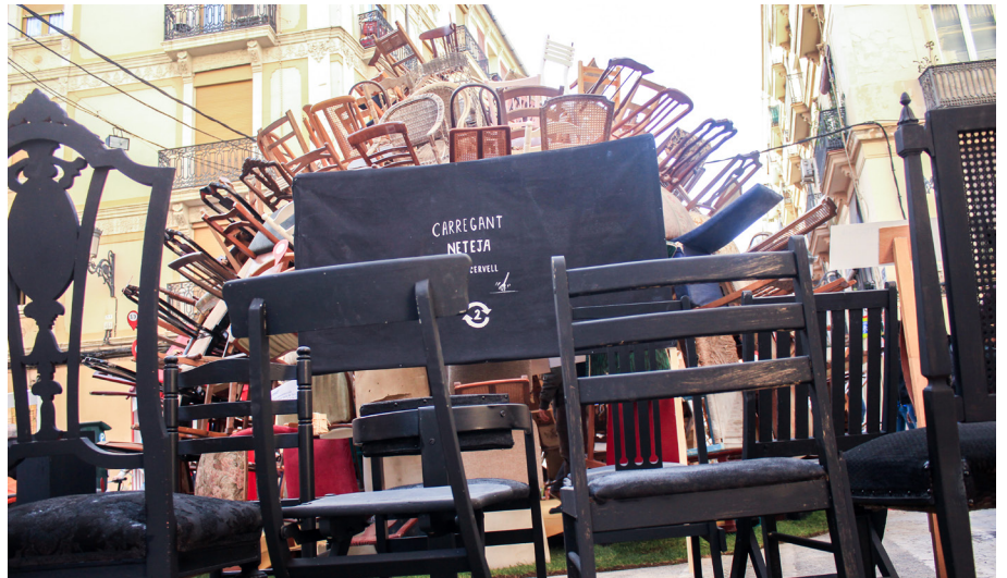
19. Escena deset. #ARTBC Parck

L'art tothom el crítica sense cap tipus d'argument i els jurats fallers són triats a dit i sense tindre cap tipus d'estudis ni acreditació artística. En aquesta escena vam fer una màquina expenedora gratuïta de carnets de crític d'art i de jurat faller com a crítica a la falta d'educació artística.