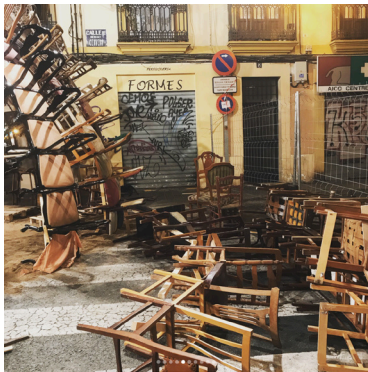
40. Imatges del dimarts 13 de Març en diferents hores del dia.

Durant tot l'any vam estar una mica restringits, ja que per molt que férem les columnes i l'estructura, no sabíem si la cúpula anava a aguantar a causa que no teníem on provar-la. Les columnes les agrupàvem al baix que tenim a la disposició de la falla, però no és molt gran, mesura uns 50 metres quadrats i uns 3 d'alt aproximadament.