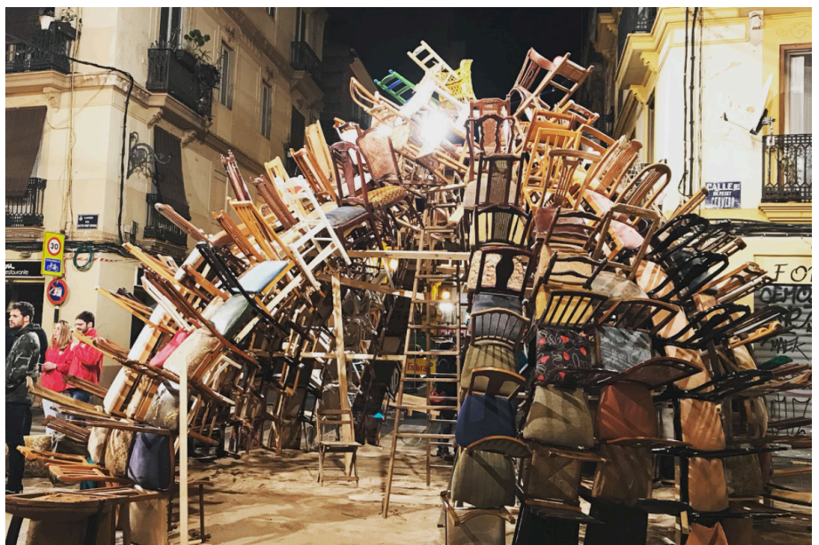
41. Imatges del dimarts 13 de Març en diferents hores del dia.

Així que, encara que molt treball va ser previ, un altre gruix del treball ho realitzarem quan vam poder tallar el carrer el dia 8 de Març. Ací començarem a traure les columnes al carrer i a juntar la part de dalt de la cúpula, començarem a plantejar formes d'alçar les columnes i de fer proves abans del dia de la plantà.