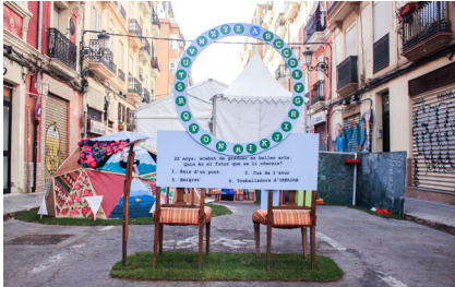
15. Escena catorze. #ARTur