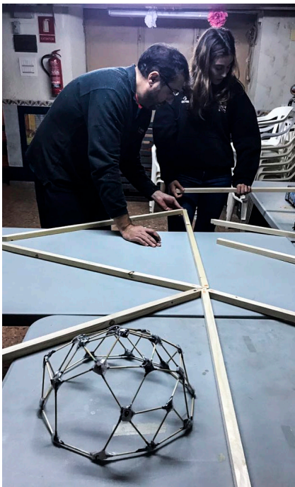
27. Detall càlcul angle llistons i maqueta

La cúpula era un dom de tres metres de diàmetre construït amb llistons de fusta de 2cm de grossor tallats a 0,92 (A) i 0,82(B) depenent d'on se situara el llistó. Així hi havia dos tipus de llistons, A i B, que componien triangles de diferents grandàries.