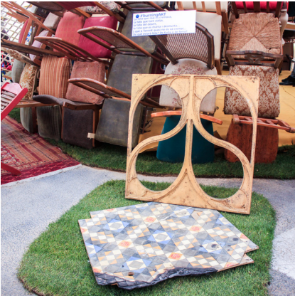
4. Escena cuarta. #burningART

La falla que mai es crema, la falla que tant viatja, la falla del dessert, la falla que es munta i desmunta... i que a Torrent no es va cremar... ¿de què estarà feta? ¿de fusta o de ferro?