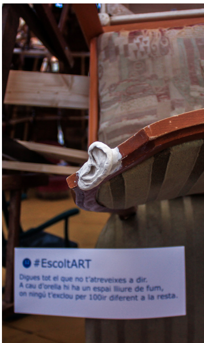
13.Escena dotze. #escoltART

Avui dia el suport a l'art és cada vegada més somiat entre els ciutadans, l'IVA cultural puja, l'educació artística es converteix en optativa i mentrestant, alguns polítics es queden diners que podrien destinar a l'art. Aquesta escena era una caseta de venda de tiquets on podies adquirir l'entrada a l'interior de la cúpula gratis amb el 21% d'IVA inclòs.