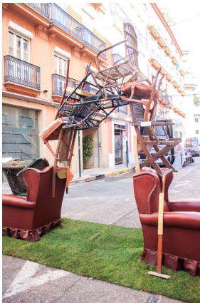
20.Escena dènou. #ARTco

Prova com sona la teua música, crea una sintonia que serà per al festival d' #a100ir, #a100ART una melodia participativa.