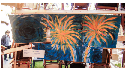
3. Tercera escena. #a100ir #a100ART