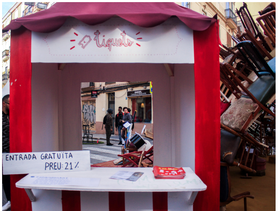
14.Escena tretze. #abandonART