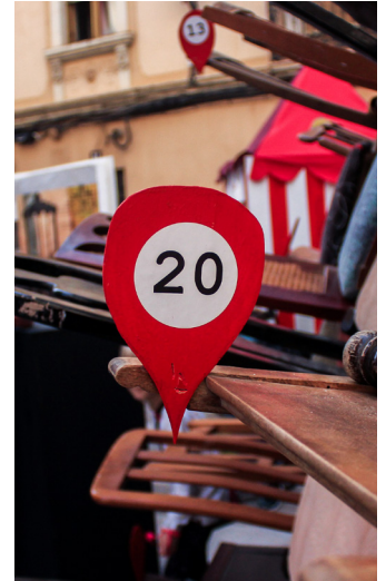
25. Elements geolocalitzadors.