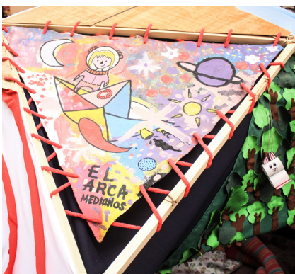
32. Detall participació de L'Arca Natzaret

Per a donar més rigidesa a l'estructura emplenarem alguns triangles de xapa i de vareta, ja que en algunes parts era encara una mica inestable. Una vegada construïda l'estructura la guardarem desmuntada, i gràcies a que havíem assignat les lletres als llistons i amb ajuda de la maqueta, vam poder muntar-la més ràpid el dia de la plantà infantil.