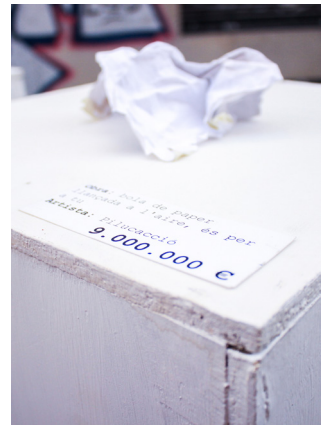
22.Escena vint. #consumiART, detall.

La música també és un art, i és per això que volguérem crear aquest espai músic-interactiu on la gent poguera participar. Tots els instruments els vam fer de materials reciclats o reutilitzats i a la fi va sorgir coses com percussió i alguns instruments de vent i corda.