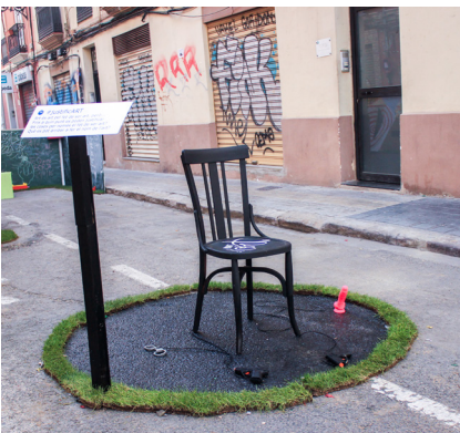
8. Escena octava. Punt d'Art. #justificART

Art es art per el fet de ser art, però... fins a quin punt es poden justificar les coses per asoles el fet de ser art? Què es pot arribar a fer el nom del art?