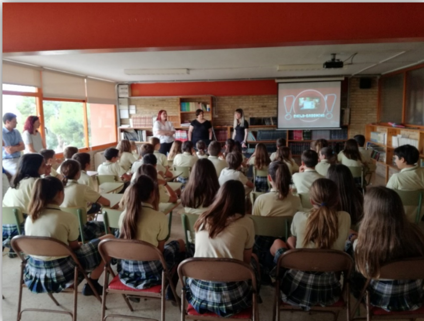
Figura 1. Situación real de la intervención “Child Grooming” en el Colegio Alfinach.

Sesión final. Esta sesión se desarrolló en el aula como reflexión del trabajo realizado, dudas y otras cuestiones para su mejora y entrega de un informe escrito con la descripción de la herramienta de prevención para su posterior evaluación como parte práctica de la asignatura.