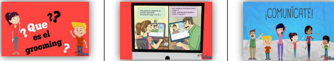
Figura 3. Ejemplo de 6 diapositivas de la intervención INTUYE EL “CHILD GROOMING”