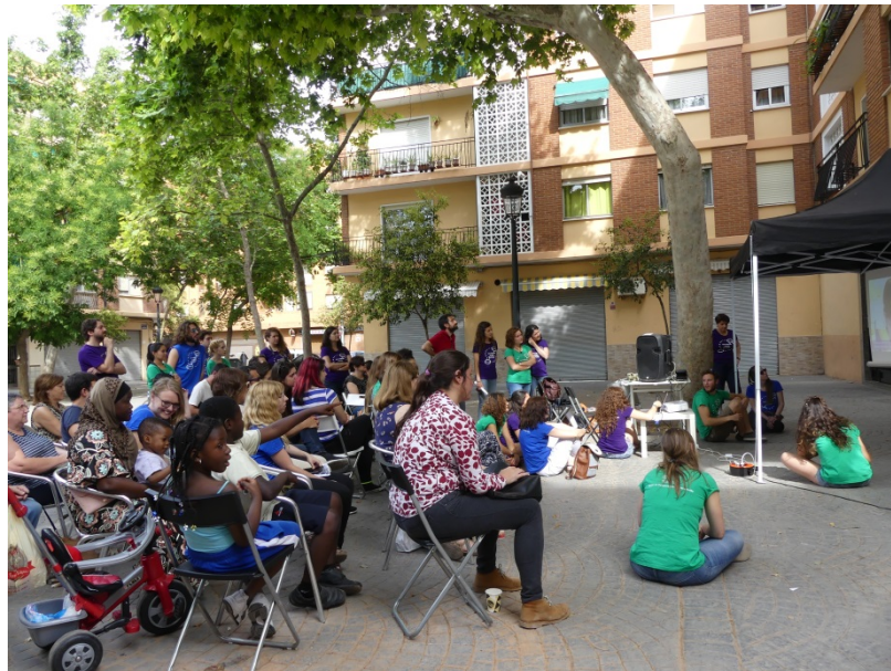
Imagen 3: Estudiantes y vecindario visionando el vídeo durante la presentación pública