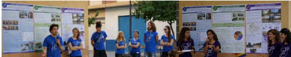
Imagen 2: Estudiantes presentando los pósters durante la presentación pública