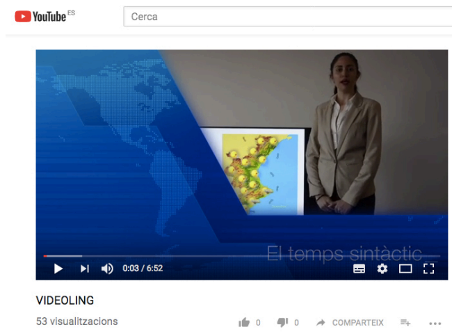
Fig. 5 Imagen del noticiero didáctico realizado por los alumnos del Máster

Otro ejemplo de proyecto desarrollado por el alumnado del Máster de Secundaria donde se emplea la difusión de una producción audiovisual en Youtube, es la creación de un “videoling” (vídeo lingüístico), que consiste en crear un noticiero didáctico para trabajar cuestiones lingüísticas. El noticiero consta de tres partes, en que los alumnos tienen que grabar una serie de vídeos simulando las diferentes secciones de los informativos. La primera se explicará a partir de la sección del tiempo y tratará de cuestiones de sintaxis con el análisis de una serie de titulares. En segundo lugar, se dedica unos minutos a un “anuncio-denuncia”, en el que se destaca algún tema de problemática social y se trabaja el eslogan publicitario. Por último, se corrigen errores ortográficos de algunos textos que aparecen en fotografías de lugares de la ciudad donde los alumnos han encontrado estos errores.