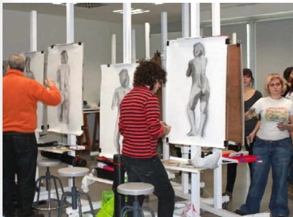
Video aula de dibujo