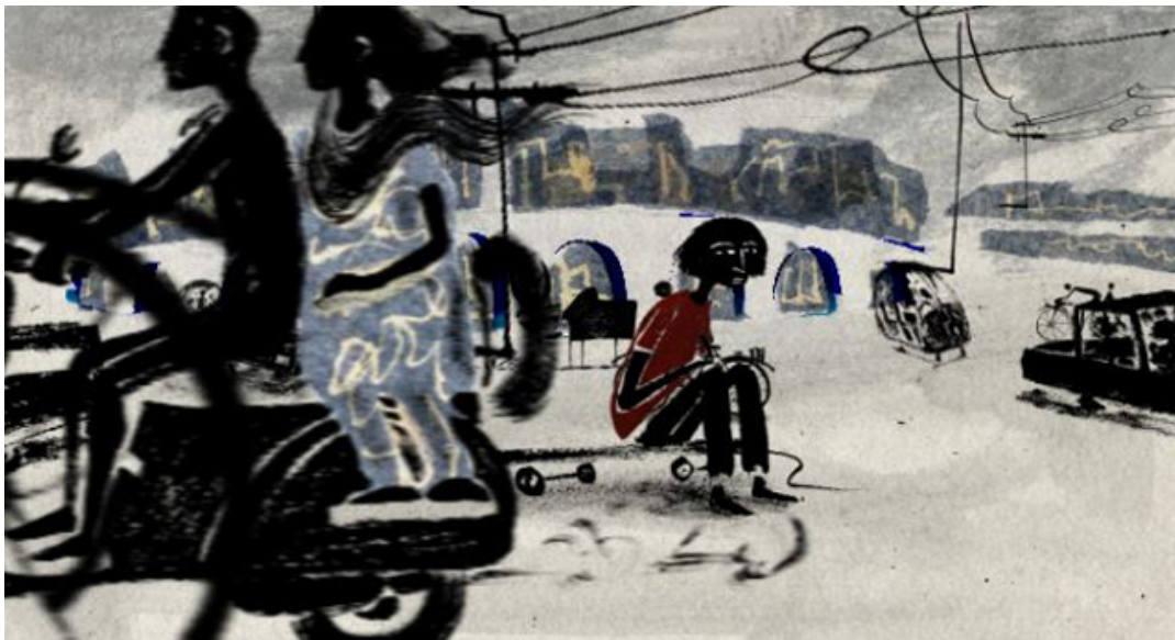
Fotograma de Ámár , de Isabel Herguera (2010).

Esta joya de ocho minutos y cuarenta segundos es una muestra del dominio del movimiento, el dibujo y la composición. Ámár es la historia de Inés, que tras unos meses de ausencia regresa cumpliendo la promesa que le hizo a su amigo Ámár. Desea que este le ayude a recuperar los recuerdos de un viaje que ambos hicieron