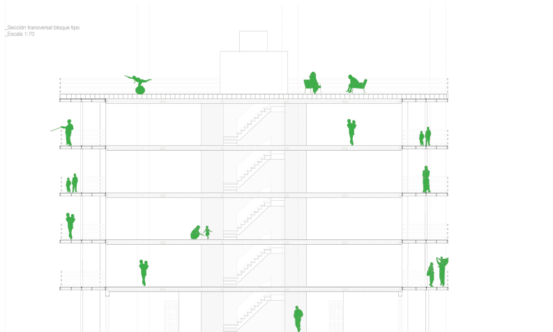
Sección transversal bloque tipo Escala 1/10