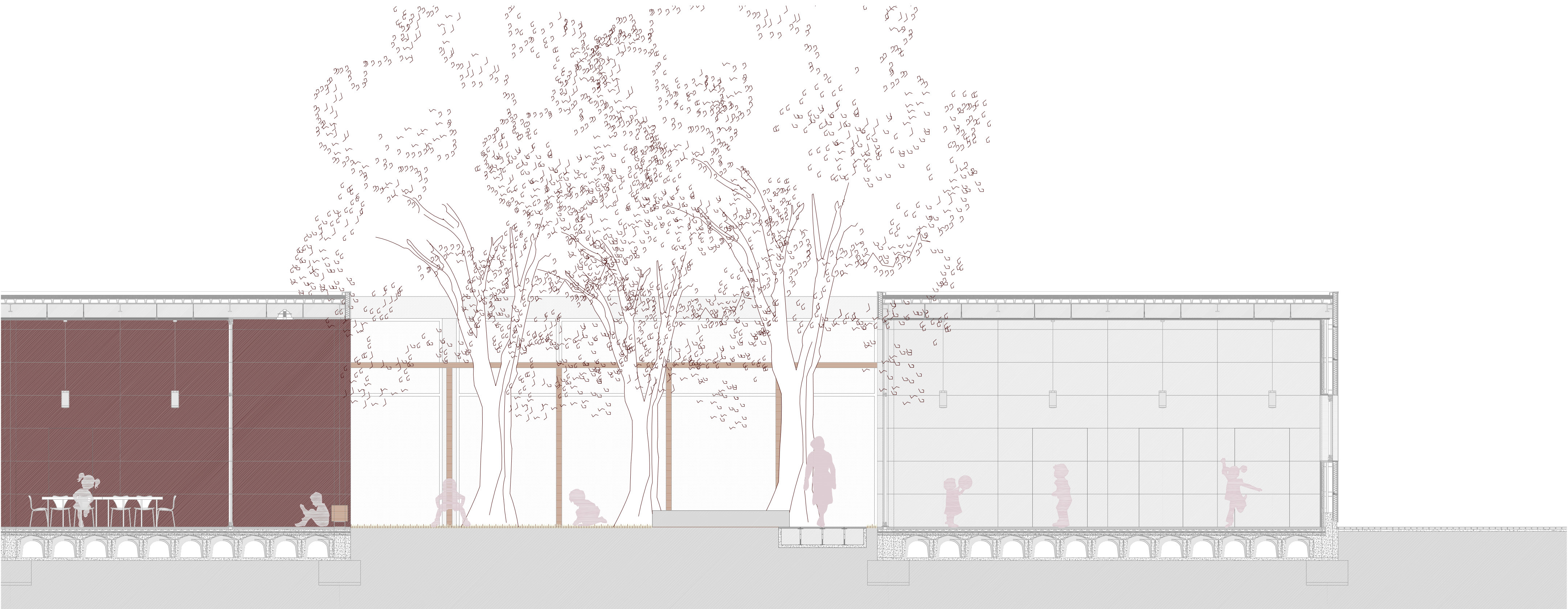
SECCIÓN C-C' E: 1/50