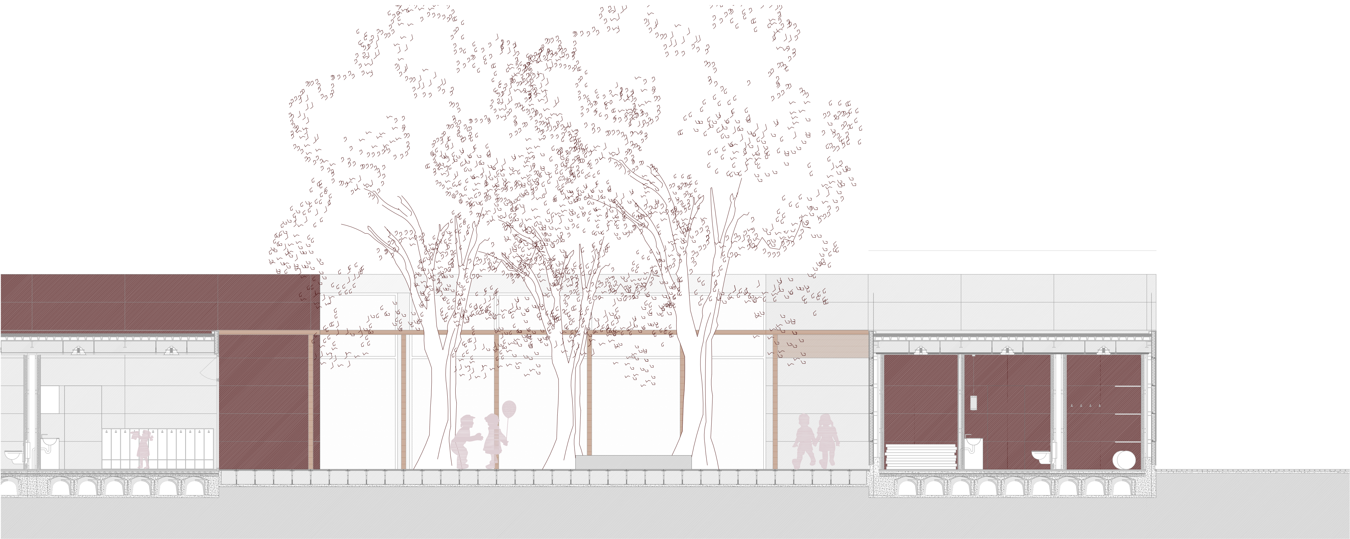
SECCIÓN D-D' E: 1/50