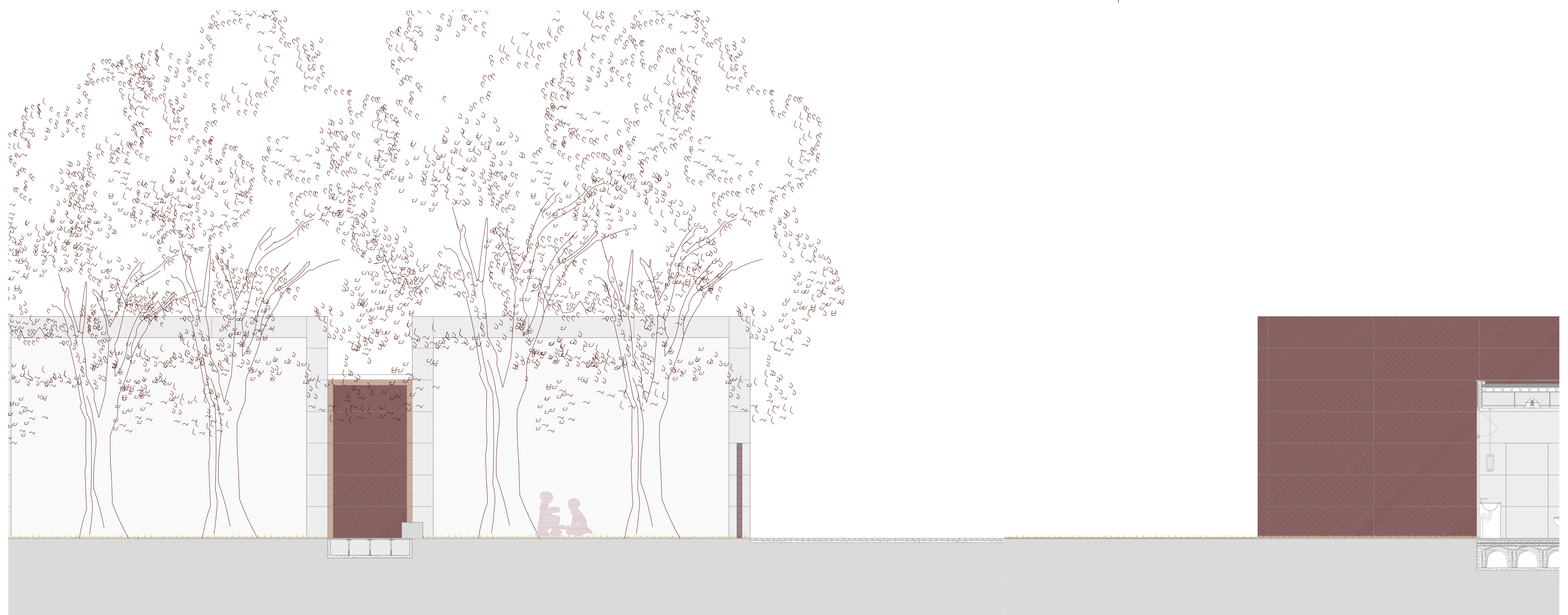
SECCIÓN B-B' E: 1/50