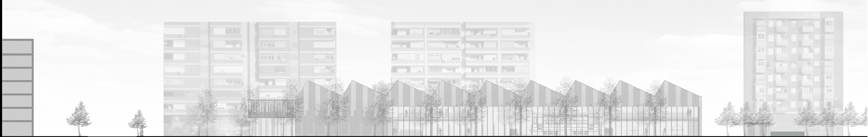
SECCIÓN GENERAL OESTE ESCALA 1:500