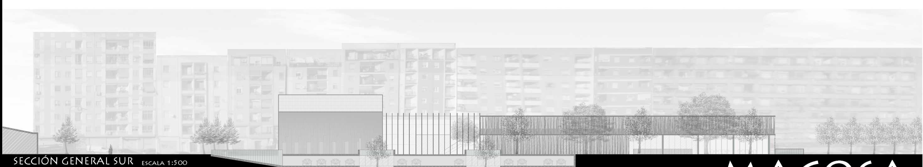
SECCIÓN GENERAL SUR ESCALA 1:500