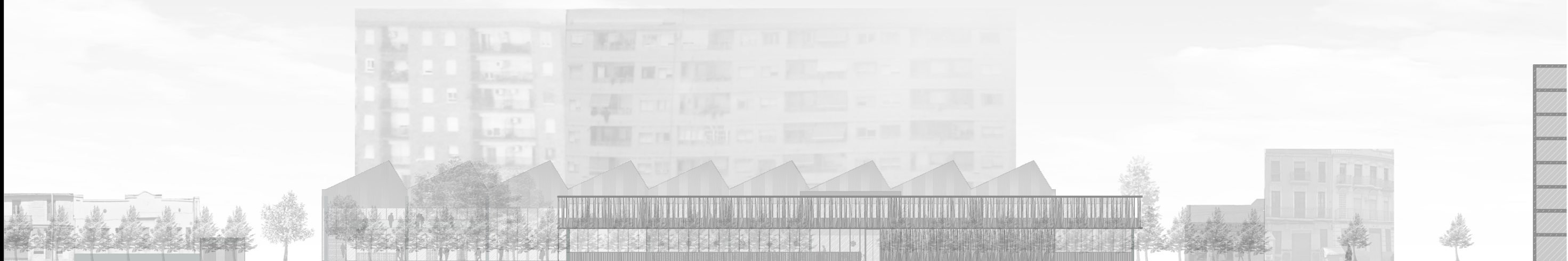
SECCIÓN GENERAL ESTE ESCALA 1:500