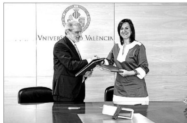
La alcaldesa de Torrent junto al rector de la Universitat.

Una de las posibilidades que abre este convenio es la «estancia de estudiantes de la Universitat de València en el Ayuntamiento de Torrent, mediante programas de cooperación educativa», resalta Morcillo. De esta manera, los estudiantes de la Universitat de Va-