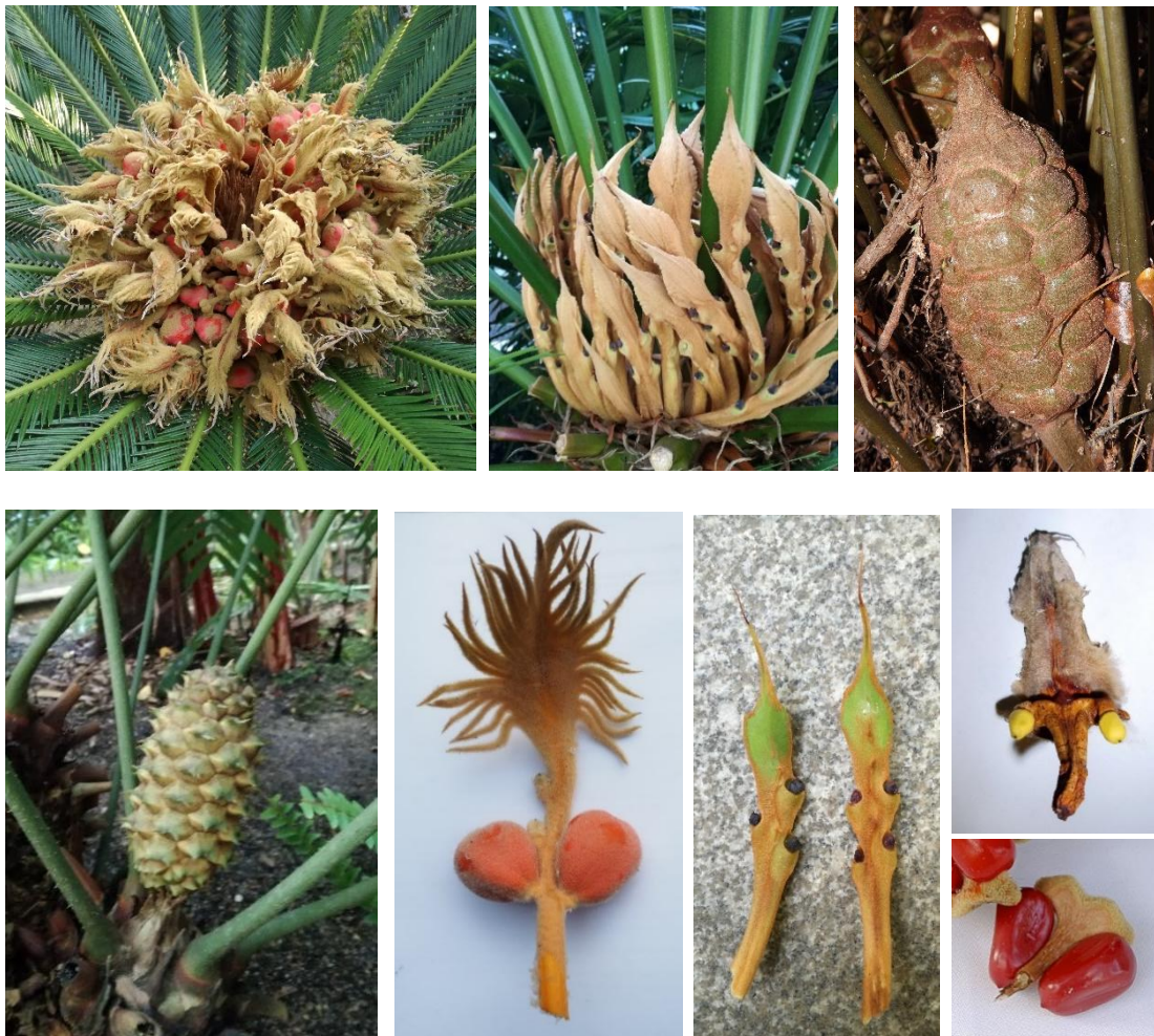
Figura 3. Diversidad de estructuras femeninas en los cicadópsidos. De arriba abajo y de izquierda a derecha: masa terminal de Cycas revoluta ; conjunto de megasporófilos de Cycas rumphii ; estróbilos de Zamia pumila, Ceratozamia mexicana , megasporófilos de Cycas revoluta , de Cycas circinalis , de Dioon edule, y de Zamia furfuracea .

En las plantas femeninas, los primordios seminales se ubican también en conos, a excepción del género Cycas . Los conos femeninos suelen ser más grandes que los masculinos. Los conos femeninos son apretados y constan igualmente de un eje de crecimiento determinado con megasporófilos dispuestos helicoidalmente alrededor de él. Los megasporófilos poseen un pedicelo y un segmento terminal en forma de lámina peltada o escuamiforme (como una escama). En la base de este segmento se localizan dos primordios seminales. En el género Cycas , estos conos no existen en sentido estricto, y los megasporófilos aparecen formando masas densas. Poseen una zona pedicular y una zona terminal ensanchada, con distintas formas: serrada, pectiniforme (segmentada como un peine), o pinnada (como en las hojas que poseen folíolos a ambos lados del raquis). Los primordios seminales (entre dos y ocho) se disponen en la zona pedicular del megasporófilo (Figura 3).