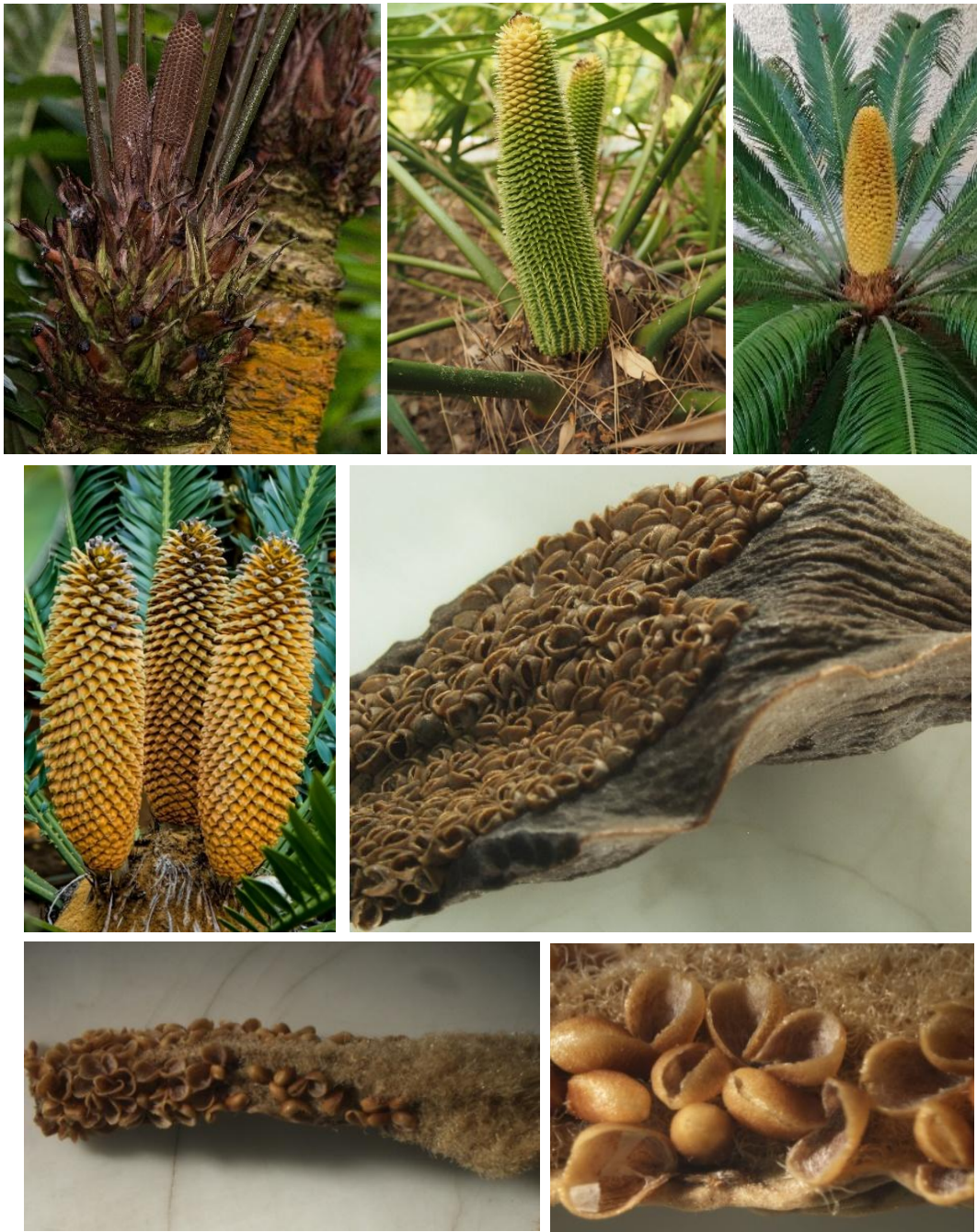
Figura 2. Diversidad de estróbilos masculinos en los cicadópsidos. De arriba abajo y de izquierda a derecha: Zamia sp.; Ceratozamia mexicana , Cycas revoluta , Encephalartos natalensis, sacos polínicos abiertos en el envés de una escama (microesporófilo) de Cycas circinalis ; escama con sacos polínicos de Cycas revoluta ; detalle de los sacos polínicos abiertos y cerrados de Cycas revoluta