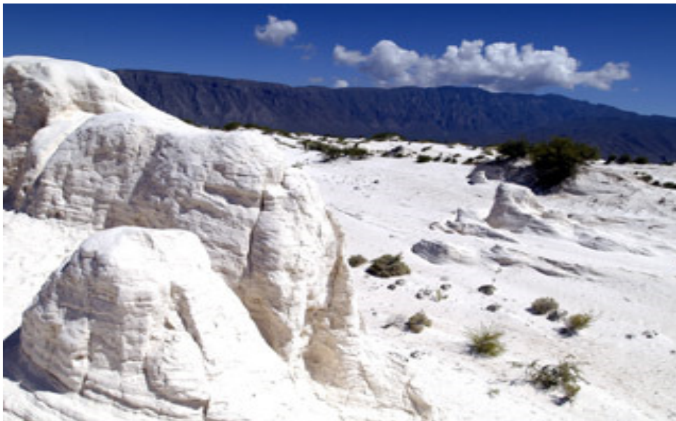
Imagen 1: Dunas de Yeso en Cuatrociénegas, Coahuila.

El yeso se originó hace 200 millones de años como resultado de depósitos marinos cuando parte de lo que ahora son nuestros continentes eran inmensas extensiones oceánicas. Durante este período algunos mares se secaron dejando lechos de yeso que se recubrieron para ser descubiertos posteriormente por el hombre (Candel 1972).