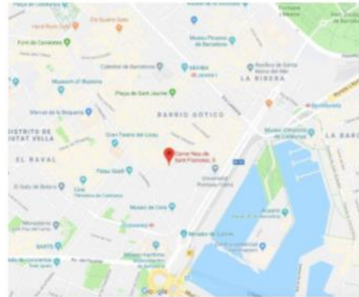
Imagen 2: Ubicación del local