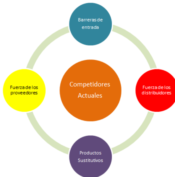
Imagen 4: Modelo 5 fuerzas de M. Porter

Es uno de los modelos más utilizados para analizar los factores estratégicos del entorno específico. Son las cinco fuerzas que más influyen en la estrategia competitiva de la empresa que determinan las consecuencias de rentabilidad a largo plazo.