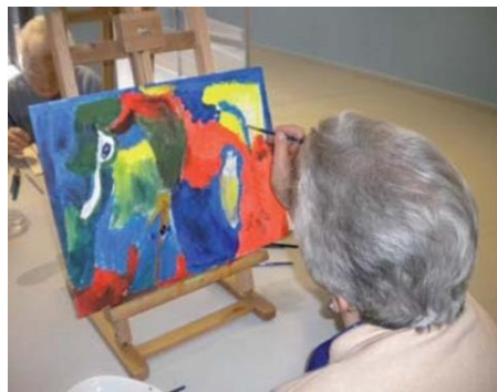
Figura 4. Últimas pinceladas.

Las obras resultantes de los participantes sin lugar a dudas tienen que ver con el concepto abstracción o puntillismo. Corrientes artísticas que tratamos a lo largo de las sesiones. Asimismo, cabe destacar que en ocasiones los participantes se “copiaban” unos a otros en cuanto a estilos. Al ver nuestra aprobación y considerando la forma de trabajar del compañero como válida, el resto de participantes continuaron realizando el mismo proceso.