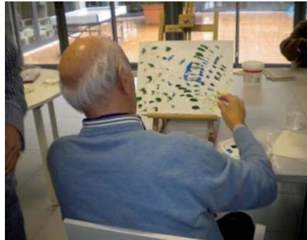
Figura 3. Encajes. Marzo 2011.

Aplicada la imprimación y una vez seca, podían proceder a pintar lo que ellos recordaban sobre su trabajo. La mayoría de los participantes escogieron realizar campos de color. Por lo tanto, se centraron en la abstracción como forma de expresión. (Véase, figura 3).