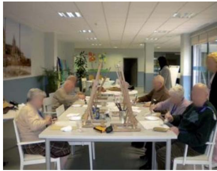
Figura 2. ESPACIO DE TRABAJO. Fase Imprimación de tablas.